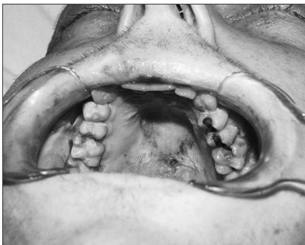
Obr. 1 Změny na patrové sliznici při orálních projevech GVHD

nosupresiv, v nynější době nejčastěji cyklosporinu A. V počátcích alogenní transplantace byla preferována transplantace syngenní (mezi jednovaječnými dvojčaty), právě pro imunologickou identitu. Postupně bylo zaznamenáno více relapsů základního onemocnění. Důvodem je právě shoda genetického materiálu a tedy tendence k opakovanému výskytu malignity. Při transplantaci alogenní dřeně od sourozence je výskyt GVHD vyšší, klesá však výskyt relapsů základního onemocnění. Je zřejmé, že oba jevy spolu souvisejí a do jisté míry je GVHD žádaná právě pro protinádorový efekt (reakce lymfocytů dárce proti „zbytkům“ příjemcova nádoru). Proto tento jev označujeme také jako reakci štěpu proti leukemii (graft versus leukemia GVL) [20].