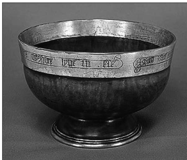
Obr. 1 Nádobu Mazer z javorového dreva s obrubami z pozláteného striebra, pochádzajúca z roku 1380 [12]