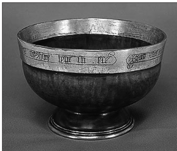
Obr. 1 Nádoba Mazer z javorového dreva s obrubami z pozláteného striebra, pochádzajúca z roku 1380 [12]