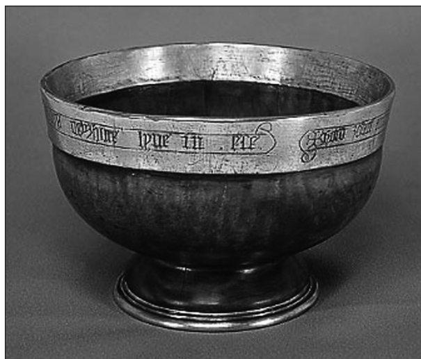
Obr. 1 Nádobu Mazer z javorového dreva s obrubami z pozláteného striebra, pochádzajúca z roku 1380 [12]