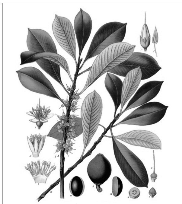
Obr. 2 Palaquium gutta [4]

Gutaperča je trans-izomér polyizoprénu (obr. 3). Hoci má molekulárnu štruktúru blízku prírodnému kaučuku