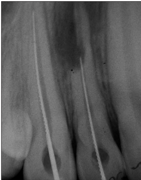
Obr. 1b. Rentgenogram poraněných zubů v průběhu endodontické terapie.