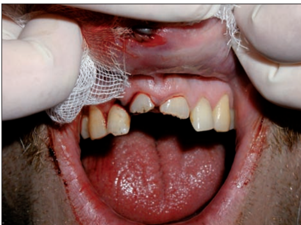
Obr. 2a. Intruzivní luxace zubů 11 a 21 u 53letého pacienta (situace v den úrazu).