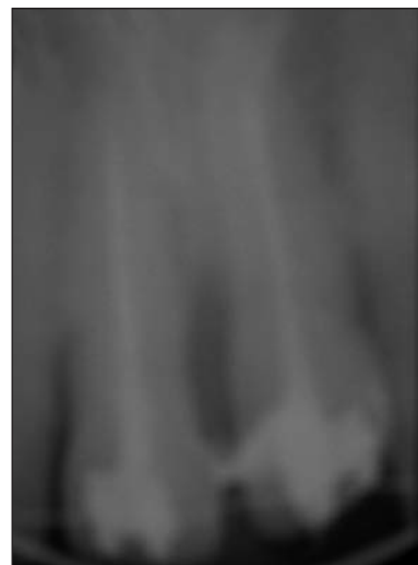
Obr. 2d. Rentgenogram po endodontickém ošetření.