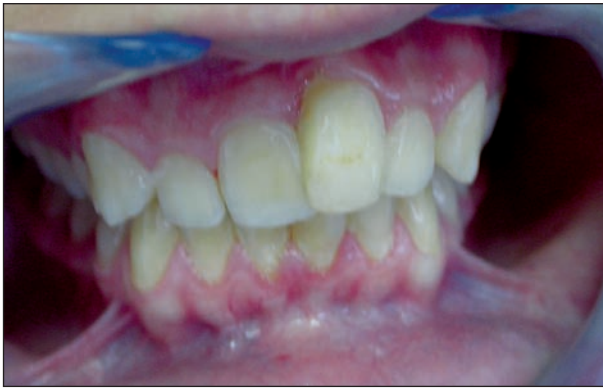
Obr. 1a. Pacient ve věku 15 let, situace 5 měsíců po úrazu zubů 11 a 21 (u zubu 21 provedena chirurgická extruze).