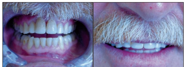
Obr. 2e, f. Stav po dostavbě zubů 11 a 21 kompozitním materiálem.