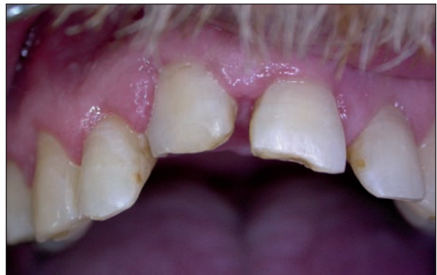
Obr. 2c. Stav po ortodontické extruzi.