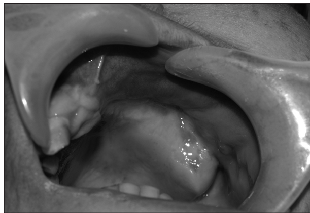
Obr. 4. Stav tři měsíce po operaci.

sinu. Bylo indikováno endoskopické vyšetření levé čelistní dutiny s odběrem tkáně v celkové anestezii, které však mykotickou infekci nepotvrdilo. Poté při naší kontrole zjišťujeme nevýraznou pohyblivost alveolárního výběžku a patra. Následující den byla pacientka připravena k subtotální resekci horní čelisti. Při intubaci byl celý kostní fragment vylomen laryngoskopem (obr. 3), po úpravě kostních okrajů a revizi čelistní dutiny byl defekt vykryt tamponádou a následně krycí patrovou deskou.