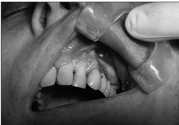
Obr. 2. Nekrotická kostní tkáň alveolárního výběžku maxily.