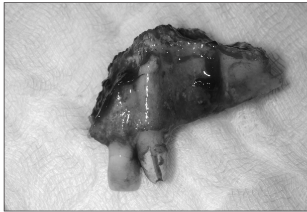
Obr. 3. Kostní resekát postižené části maxily.