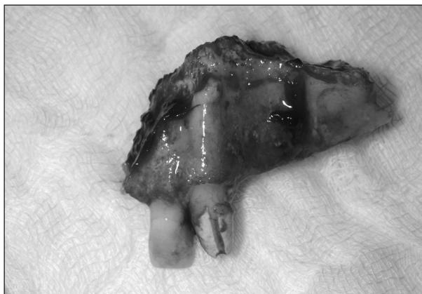
Obr. 3. Kostní resekát postižené části maxily.