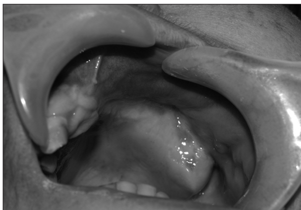
Obr. 4. Stav tři měsíce po operaci.

sinu. Bylo indikováno endoskopické vyšetření levé čelistní dutiny s odběrem tkáně v celkové anestezii, které však mykotickou infekci nepotvrdilo. Poté při naší kontrole zjišťujeme nevýraznou pohyblivost alveolárního výběžku a patra. Následující den byla pacientka připravena k subtotální resekci horní čelisti. Při intubaci byl celý kostní fragment vylomen laryngoskopem (obr. 3), po úpravě kostních okrajů a revizi čelistní dutiny byl defekt vykryt tamponádou a následně krycí patrovou deskou.