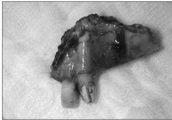
Obr. 3. Kostní resekát postižené části maxily.