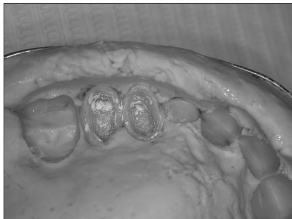
Obr. 2. Náhrada očištěná od zbytku provizorního cementu.

Mezi častější komplikace, se kterými se setkáváme při otiskování, patří také vomitus [13]. Těto komplikaci se nedá vždy předejít, ale její projevy můžeme při dodržování určitých zásad zmírnit. U nového pacienta je nutné anamnesticky zjistit, zda již někdy absolvoval otiskování v ústech a jak je snášel. Jedná-li se o pacienta, který má problémy s dávným reflexem, musíme se držet několika zásad. Pacienta požádáme, aby při otiskování dýchal nosem a otiskujeme v poloze vsedě. Během tuhnutí otiskovací hmoty se pacient předkloní a nechá volně vytékat sliny do předem připravené emetní misky. Otiskovací lžiči nepřepřlujeme, do její dorzální části vložíme jen nezbytné minimum otiskovací hmoty. Pokud je to nutné, můžeme pomocí povrchové anestezie znecitlivět patrovou sliznici. Obecně používanou stomatologickou technikou u pacientů se zvýšeným dávným reflexem je aplikace kuchyňské soli na kořen jazyka, čímž lze preventivně zabránit vomitu. U úzkostných pacientů s vystupňovaným vomitem je možná medikamentózní příprava, např. benzodiazepiny