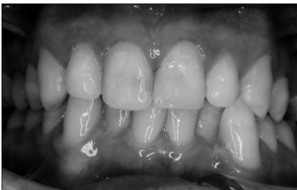
Obr. 2. Stav po ošetření zubu 21 v místní anestezii.