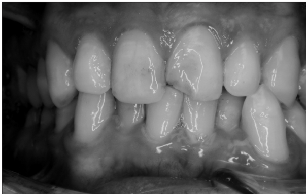
Obr. 1. Nekomplikovaná fraktura zubu 21 u pacienta s mentální retardací středního stupně.

Příkladem pacienta, kterého se nám podařilo převést z ošetření v celkové anestezii k ambulantním výkonům, je 24letý muž s mentální retar-