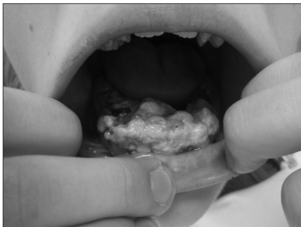
Obr. 3. Mentálně retardovaná pacientka s malhygienu.