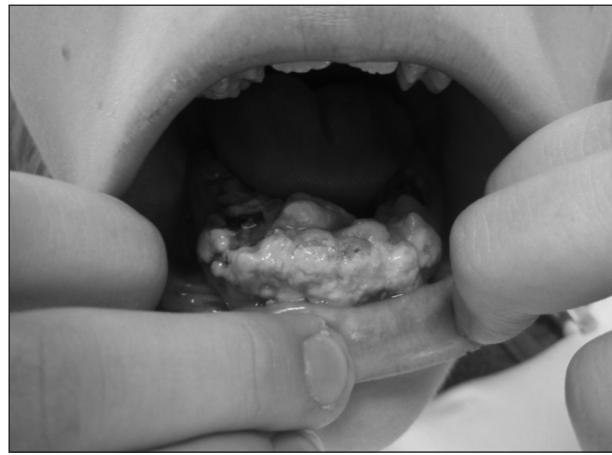
Obr. 3. Mentálně retardovaná pacientka s malhygienou.