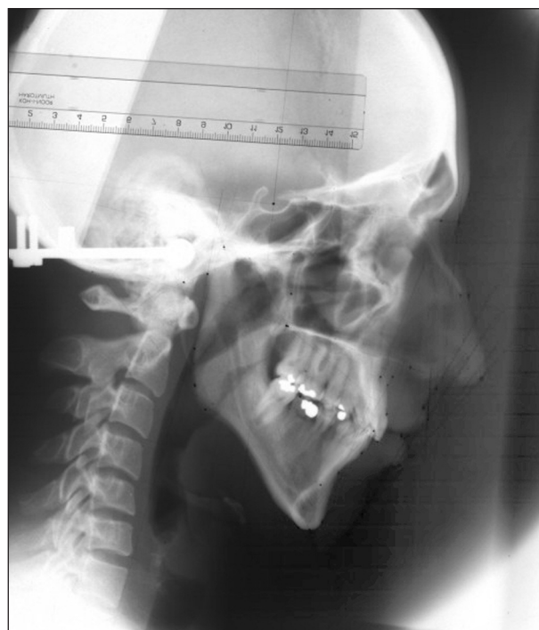
Obr. 2. Digitalizace RTG obrazu, včetně jeho kalibrace.

(antropometrie), ortodoncie (studijní modely), radiologická data (telerentgenogram). Tato komplexnost zdrojů činí terapeutické rozhodování obtížným zvláště u pacientů s výrazně asymetrickými vadami. Z těchto důvodů bylo vyvinuto několik typů trojdimenzionálních chirurgických analýz, simulačních softwarů a metod [4, 7, 11, 13, 14, 19, 21, 22, 23].