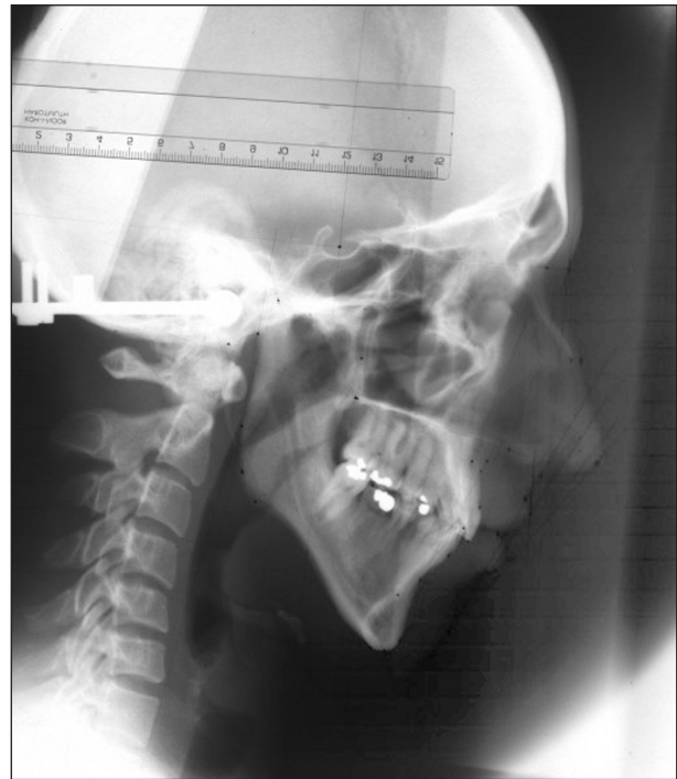
Obr. 1. Telerentgenogram, včetně jeho kalibrace před počítačovou úpravou.