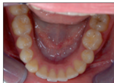
Obr. 2d. Intraorální pohled na dolní zubní oblouk 4 roky po sejmutí pevného ortodontického aparátu.