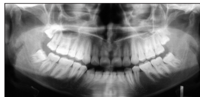
Obr. 3c. Ortopantomogram 4 roky po sejmutí pevného ortodontického aparátu.

(0,84 %), jeden dolní řezák v 10 případech (2,1 %). Ve zbývajících 14 případech (2,94 %) se jednalo o vynucené extrakce (retinované zuby v nevýhodné poloze, s ankylozou nebo tvarovou malformací). Asymetrické extrakce v obou čelistech byly indikovány v 10 případech (2,1 %).