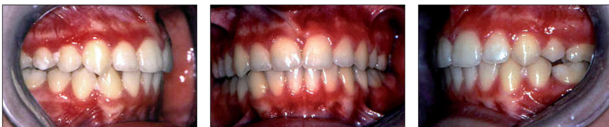
Obr. 6a, 6b, 6c. Intraorální pohled po sejmutí pevného ortodontického aparátu.