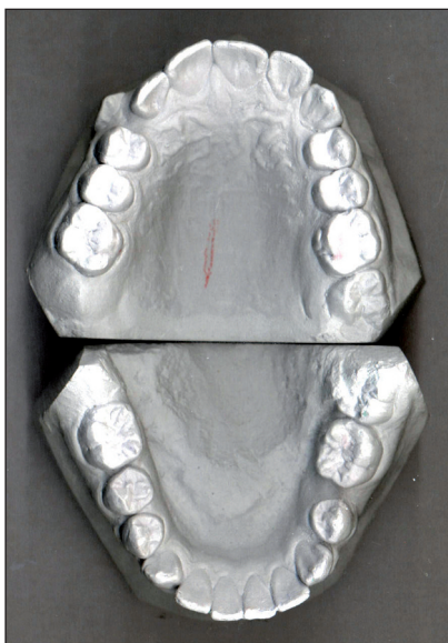
Obr. 2a. Ortodontické dokumentační modely před zahájením léčby.