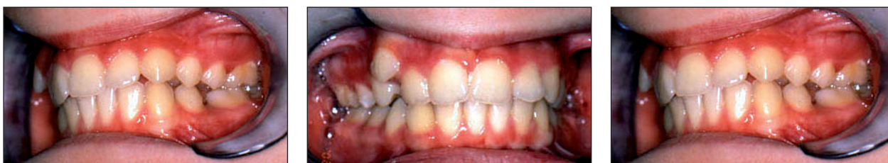
Obr. 1a, 1b, 1c. Intraorální pohled před zahájením léčby.

Symetrické extrakce v horním zubním oblouku