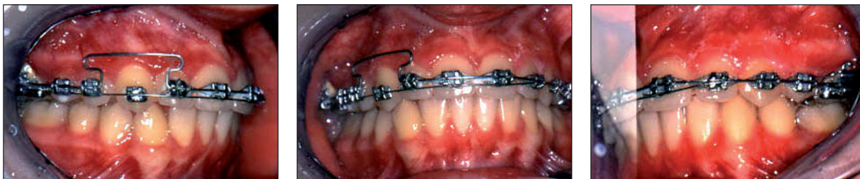
Obr. 5a, 5b, 5c. Intraorální pohled v průběhu léčby.