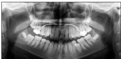
Obr. 3a. Ortopantomogram před zahájením léčby.