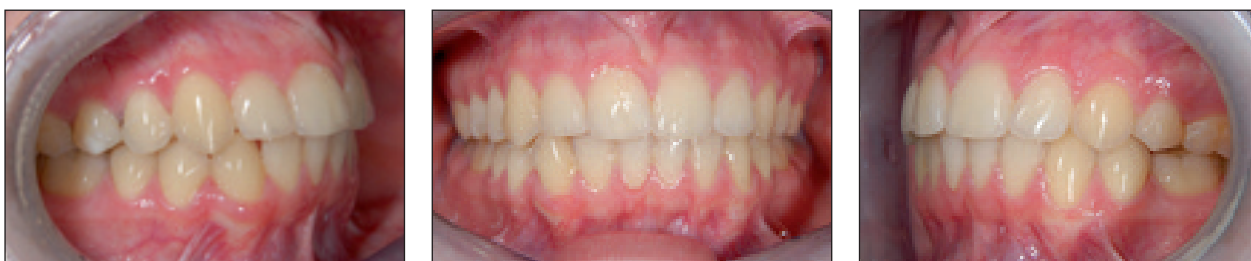
Obr. 7a, 7b, 7c. Intraorální pohled 4 roky po sejmutí pevného ortodontického aparátu.

(obr. 5). Kombinace bazálního oblouku, který rigidně spojuje ostatní zuby, a pružného overlay oblouku pro extruzi špičáku, brání nežádoucímu intruznímu účinku v anteriorní oblasti. Pacientka odmítla léčbu pevným ortodontickým aparátem v dolní čelisti. Léčba pevným aparátem v horní čelisti trvala 24 měsíců. Docílili jsme plánovaných změn v horním zubním oblouku a artikulace. V dolním zubním oblouku došlo k částečnému spontánnímu uzavření mezery v místě extrahovaného levého druhého premoláru pravděpodobně tlakem prořezávajícího druhého moláru (obr. 2b, obr. 3b, obr. 6). Čtyři roky po sejmutí pevného ortodontického aparátu nosí pacientka snímací retenční deskový aparát v horní čelisti jedenkrát týdně na noc. Zbytková mezera v levém dolním kvadrantu se spontánně uzavřela, v horním zubním oblouku došlo k mírné recidivě mesiálního sklonu pravého horního postranního i středního řezáku (obr. 2c, obr. 2d, obr. 3c, obr. 7).