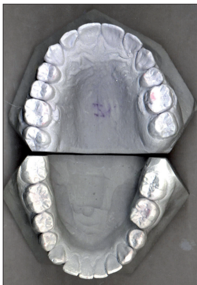
Obr. 2b. Ortodontické dokumentační modely po sejmutí pevného ortodontického aparátu.