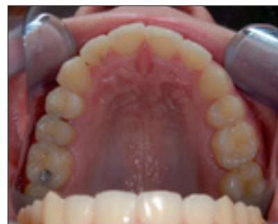
Obr. 2c. Intraorální pohled na horní zubní oblouk 4 roky po sejmutí pevného ortodontického aparátu.