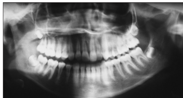
Obr. 1. OPG pacientky při prvním vyšetření.

Pacientka byla odeslána k vyšetření na naše pracoviště pro neurčité bolesti v dolní čelisti vpra-