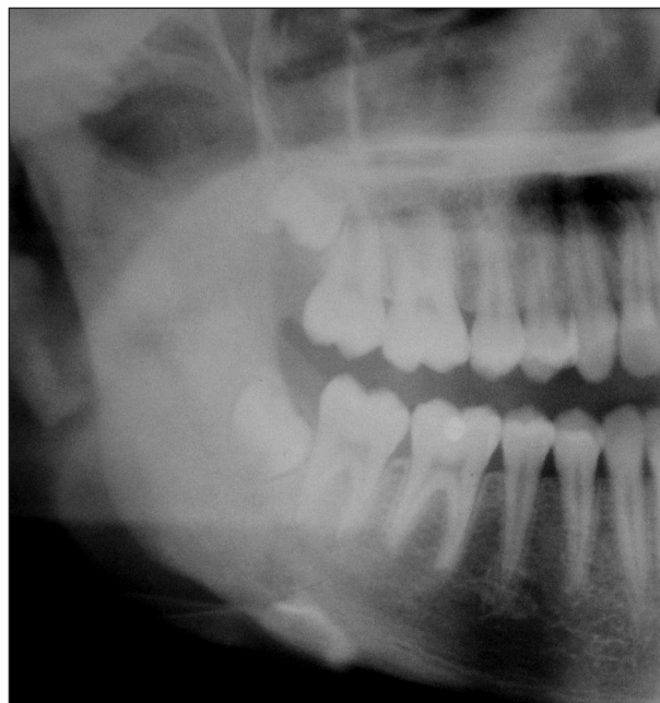
Obr. 6. OPG před zahájením léčby, výřez.

Dále byla pacientka dispenzarizována na naší ambulanci s diagnózou monoostotická forma fibrózní dysplazie. Opakovaně docházelo k relapsům bolestí v místě léze, cca v měsíčním intervalu. Docházelo postupně ke zvětšování zduření v oblasti dolní čelisti. Asi po roce a půl od první návštěvy (14leté pacientky) byla po domluvě s dětským revmatologem zahájena léčba bisfosfonátem (alendronát, 70 mg) 1x týdně. Po několika