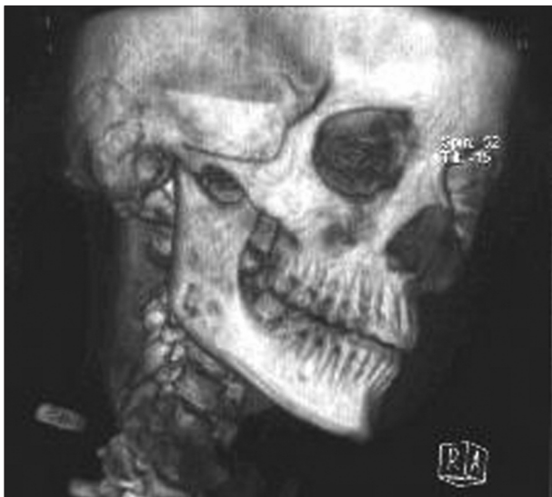
Obr. 3. Prostorová CT rekonstrukce.

vo poprvé ve 13 letech. Bolesti popisovala jako intenzivní, bodavé, počínající v oblasti zubů a šířící se do oblasti větve dolní čelisti. Kromě bolestivého místa při úponu m. maseter a drobného vyklnutí kosti dolní čelisti v oblasti lingvální kompakty distálních úseků vpravo, nebyl zjištěn při vyšetření žádný patologický nález. Byla vyloučena odontogenní příčina. Při RTG vyšetření byla pouze na OPG zachycena setřelá struktura větve a úhlu dolní čelisti vpravo (obr. 1). Na klasických snímcích lebky nebyl patrný patologický nález. Bylo provedeno CT vyšetření, které upozornilo na možný patologický proces těla dolní čelisti typu fibrózní dysplazie (obr. 2, obr. 3).