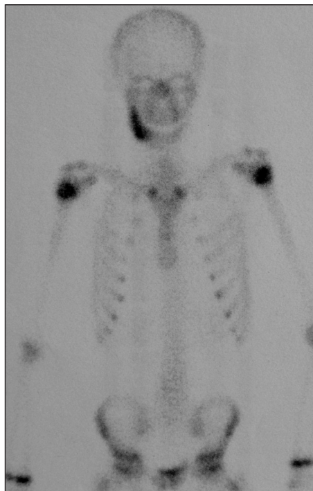
Obr. 5. Scintigrafie skeletu před léčbou

v dolní čelisti a zároveň vyloučilo přítomnosti jiných ložisek (obr. 5).