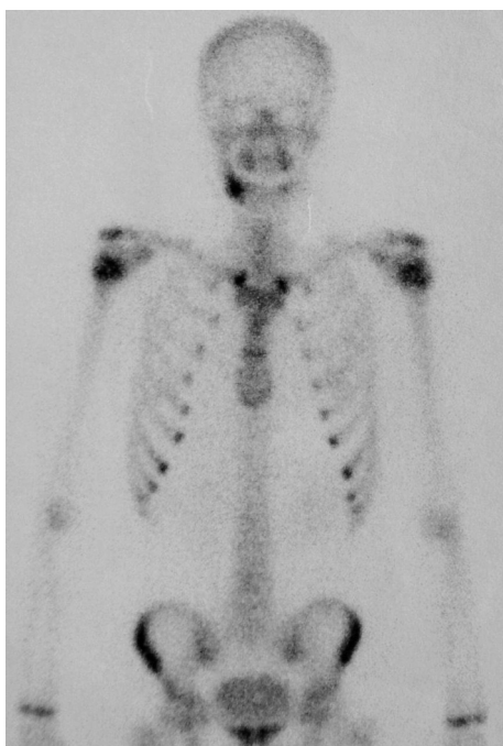
Obr. 8. Kontrolní scintigrafie skeletu po 2 letech.