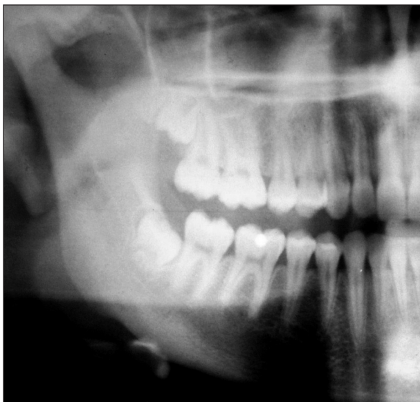
Obr. 7. OPG po 2 letech léčby bisfosfonáty, výřez.

měsících užívání preparátu došlo objektivně ke zmírnění bolesti. Nyní je pacientce 16 let a nadále užívá 70 mg alendronátu 1x týdně. Potíže jsou mírné a dostávají se nepravidelně, zabírají velmi dobře na běžná analgetika. Navíc klinicky a subjektivně již nedochází ke zvětšování ložiska v dolní čelisti (obr. 6, obr. 7). Také scintigrafické vyšetření po 2 letech léčby bisfosfonáty ukazuje zmenšení rozsahu metabolické aktivity fibrózní dysplazie v oblasti dolní čelisti (obr. 8). Kontrolní CT vyšetření vzhledem k radiační zátěži nebyla prováděna.