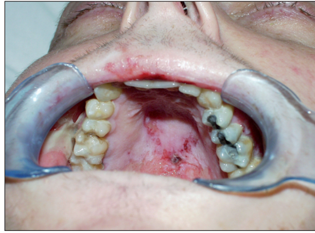
Obr. 2. Slizniční změny na tvrdém patře u pacienta s akutní reakcí štěpu proti hostiteli (21. den po alogenní transplantaci).

Standardní součástí prevence a léčby orálních mukositid je použití orálních antiseptik. V literatuře byla na toto téma publikována řada prací, jejichž závěry nejsou zcela jednoznačné. Např. Vokurka a spol. [7] nenalezli rozdíly mezi použitím jodidových preparátů jako orálních antiseptik ve srovnání s fyziologickým roztokem. Preparát Listerine, který jsme použili u našich pacientů, je antiseptikum složené z esenciálních olejů (thymol, eucalyptol, methyl salicylát, mentol) a alkoholu. Antibakteriální mechanismus jeho účinku je založen na blokádě buněčného metabolismu orálních patogenů [8]. K tomu přistupuje ještě účinek antimykotický a antivirotický [9]. Listerine má velice dobrý účinek na prevenci vzniku a odstranění již vzniklého zubního kamene. Přitom nenarušuje rovnováhu bakteriální flóry ústní dutiny a nezabarvuje sklovinu