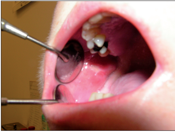
Obr. 1. Orální mukositida tvářové sliznice (II. stupeň podle NCI-CTC) u nemocné sedmý den po autologní transplantaci.

Reakce štěpu proti hostiteli (GVHD) může být závažnou komplikací alogenní transplantace kmenových buněk. Pro reakci štěpu proti hostiteli (GVHD) jsou typické těžké slizniční léze, lokalizované na gingivě, tvrdém i měkkém patře a hřbetu jazyka (nekrotická gingivostomatitis) (obr. 2). Tyto změny bývají spojeny s xerostomií a mají v chronickém stadiu často až lichenoidní charakter [15].