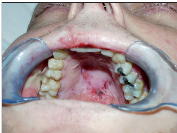
Obr. 2. Slizniční změny na tvrdém patře u pacienta s akutní reakcí štěpu proti hostiteli (21. den po alogenní transplantaci).

Standardní součástí prevence a léčby orálních mukositid je použití orálních antiseptik. V literatuře byla na toto téma publikována řada prací, jejichž závěry nejsou zcela jednoznačné. Např. Vokurka a spol. [7] nenalezli rozdíly mezi použitím jodidových preparátů jako orálních antiseptik ve srovnání s fyziologickým roztokem. Preparát Listerine, který jsme použili u našich pacientů, je antiseptikum složené z esenciálních olejů (thymol, eucalyptol, methyl salicylát, mentol) a alkoholu. Antibakteriální mechanismus jeho účinku je založen na bloádě buněčného metabolismu orálních patogenů [8]. K tomu přistupuje ještě účinek antimykotický a antivirotický [9]. Listerine má velice dobrý účinek na prevenci vzniku a odstranění již vzniklého zubního kamene. Přitom nenarušuje rovnováhu bakteriální flóry ústní dutiny a nezabarvuje sklovinu