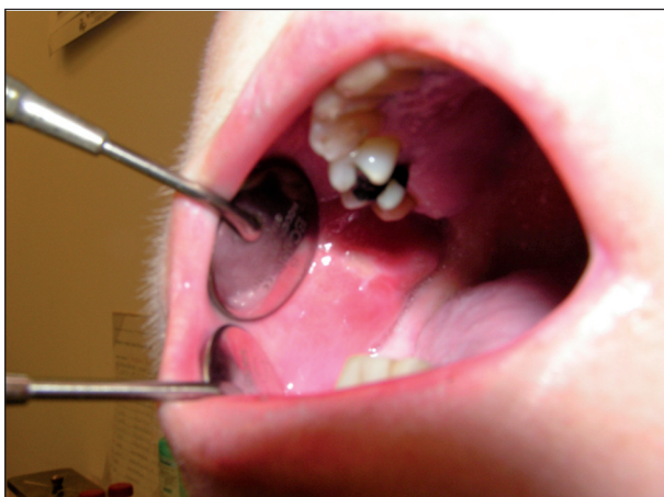
Obr. 1. Orální mukositida tvářové sliznice (II. stupeň podle NCI-CTC) u nemocné sedmý den po autologní transplantaci.

Reakce štěpu proti hostiteli (GVHD) může být závažnou komplikací alogenní transplantace kmenových buněk. Pro reakci štěpu proti hostiteli (GVHD) jsou typické těžké slizniční léze, lokalizované na gingivě, tvrdém i měkkém patře a hřbetu jazyka (nekrotická gingivostomatitis) (obr. 2). Tyto změny bývají spojeny s xerostomií a mají v chronickém stadiu často až lichenoidní charakter [15].