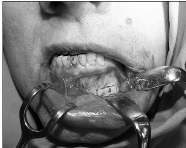
Obr. 2. Místo odběru transplantátu na mandibule.