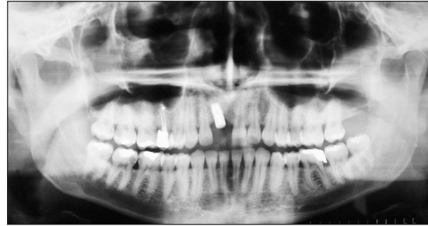
Obr. 6. Stav po zavedení dentálního implantátu SIN, stín sytosti kovu zobrazuje vlastní implantát.