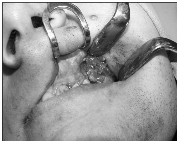
Obr. 3. Fixace transplantátu šroubkem do atrofovaného alveolu.