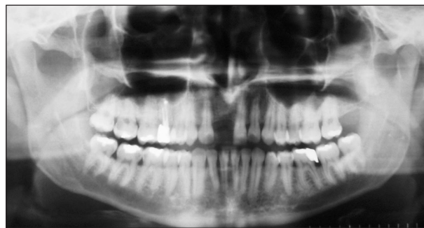
Obr. 4. Stav před léčbou- defekt po ztrátě zubu 11.

3). Poté jsme protětím periostu uvolnili mukoperiostální lalok a ránu uzavřeli suturou. Stehy z místa odběru i oblasti augmentace jsme odstranili za 6 dní. Fixační šroubek byl odstraněn z velmi krátkého slizničního řezu současně se zavedením dentálního implantátu. Průběh léčby byl průběžně sledován rentgenologicky s využitím OPG (obr. 4, obr. 5, obr. 6).