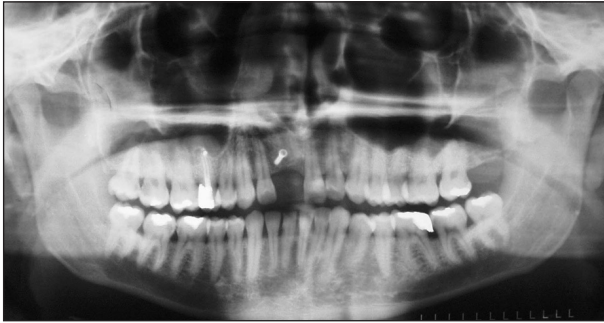
Obr. 5. Stav 4 měsíce po augmentaci, rentgenogram zobrazuje uspokojivý efekt, zejména v blízkosti zubu 21. Stín sytosti kovu v zájmové oblasti odpovídá tvarem fixačnímu šroubku.