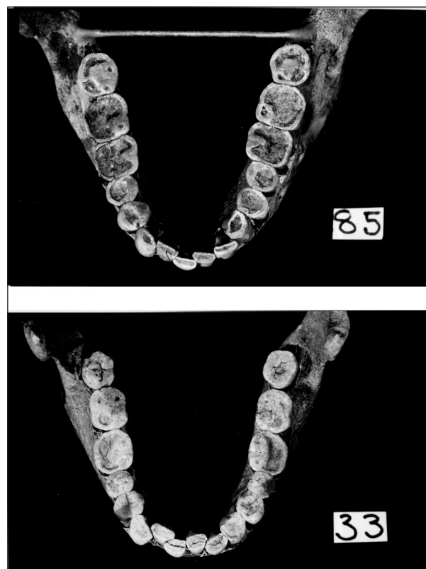
Obr. 1. Lehká a střední forma stěsnání zubů v dolní čelisti.

Lukacz [2] uvádí tabulku, z níž vyplývá, že většina zubních chorob, včetně stěsnání zubů, se vyskytuje v populaci lovců a sběračů v malé míře