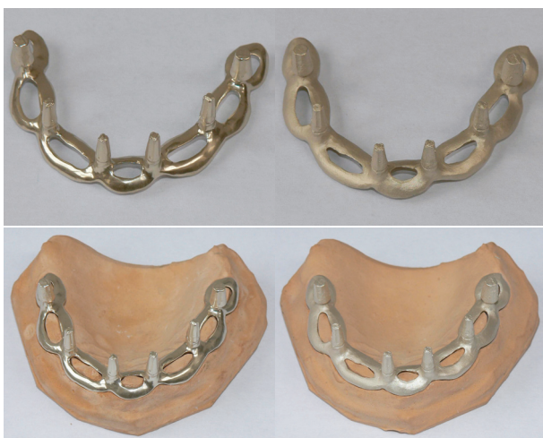
Obr. 3. Implantát povlakovaný multivrstvou Zr/ZrN: (a) leštěný, (b) drsňý.