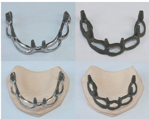
Obr. 1. Nepovlakovaný implantát: (a) leštěný, (b) drsňý.