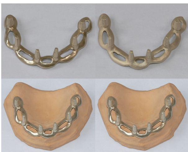
Obr. 2. Implantát povlakovaný vrstvou ZrN: (a) leštěný, (b) drsňý.