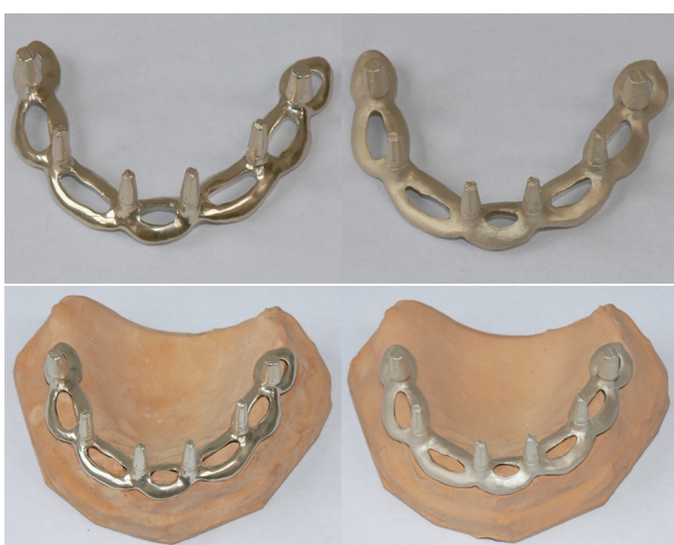
Obr. 3. Implantát povlakovaný multivrstvou Zr/ZrN: (a) leštěný, (b) drsňý.