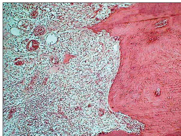
Obr. 1. Chronický zánět zubní dřevě, originální zvětšení 40x.