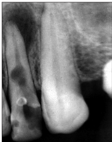
Obr. 5. RTG zuby 12 - cystogranulom po proběhlé vnitřní resorpci a následné nekróze a gangrézně zubní dřevě.