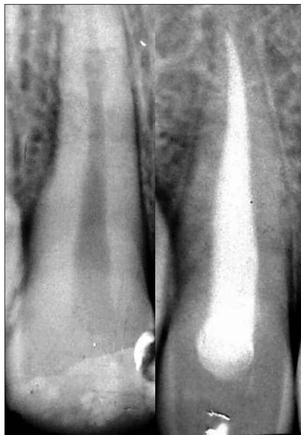
Obr. 12. Terapie malého granulomu.

Zde je nejdůležitější dobré opracování stěn kořenového kanálku a jeho dostatečné rozšíření,