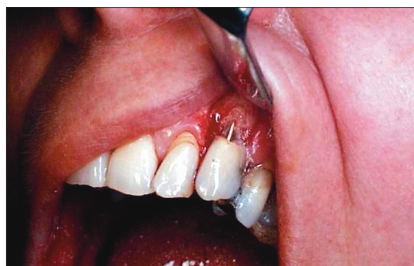
Obr. 14b. Zub 23 - perforující granulom s perforací uloženou vestibulárně, obliteraci kořenového kanálku při rekonstrukci defektu brání gutaperčový čep.