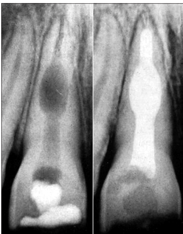
Obr. 13. Terapie středního granulomu.

Terapie je zde v podstatě podobná, pouze je nutno zdůraznit získání dobrého přístupu k lézi i za cenu určitého oslabení kořene. Exstirpace bývá někdy problematická, neboť nástroj často naráží na stěny léze. Kde to umístění granulomu dovolí, je výhodné použít malých dřevěných exkavátorů.