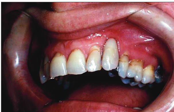
Obr. 14c. Zub 23 – stav po dostavbě resorptivního defektu skloionomerním materiálem a zevní plochy kořene kompomerním materiálem.