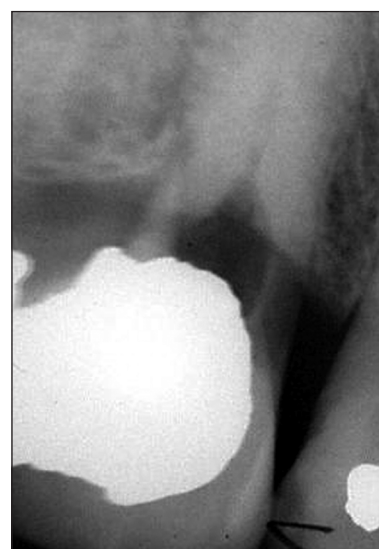
Obr. 14a. RTG zubu 23 - vnitřní granulom v oblasti gingivální třetiny kořene, vestibulární perforace není rentgenologicky patrná.

Terapie je podobná, s aplikací hydroxidu kalcia však pokračujeme v šesti až osmitýdenních intervalech, dokud na rentgenovém snímku neprokážeme uzávěr perforace tvrdou tkání. Při každém novém plnění se snažíme odstranit materiál z kořenového kanálku převážně dostatečným výplachem tenkou kanylou bez přílišného mechanického opracování, abychom nepoškodili tvořící se bariéru.