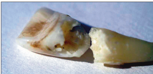
Obr. 9. Extrahovaný radix a korunka zubu po 18 letech po stanovení diagnózy (spontánní fraktura).

K tomuto výkonu se nedostavil a teprve po devíti letech se nám podařilo jej kontaktovat. Při RTG kontrole jsme resorptivní proces nenalezli (obr. 11), vitalita zubu byla pozitivní, poklep negativní a barva korunky shodná s ostatními zuby.