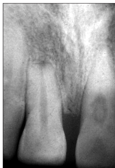
Obr. 4. RTG zubu 21 - současná resorpce i apozice tvrdé zubní tkáně. Zároveň je patrná zevní resorpce apexu u zubu 11.

- Poslední obrázek dokumentuje vnitřní resorpci v cavum pulpae zubu 47 u 45letého paci-