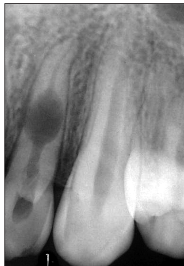
Obr. 3. RTG zubu 22 - vnitřní granulom lokalizovaný v polovině kořene.

Aspekci je možno diagnostikovat granulom při jeho lokalizaci v korunkové části dřeňové dutiny, kde může vytvořit typický obraz tzv. „pink spot“ [5], ovšem známy jsou i případy falešné pozitivity, a to zejména u zevní resorpce v oblasti cementosklovinného přechodu.