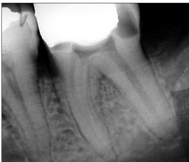
Obr. 7. RTG zuby 47 - vnitřní granulom lokalizovaný v cavum pulpa.

enta (obr. 7). Na rozdíl od zubního kazu jsou kontury ostré a hypermineralizované. Distální kořenový kanálek je zřejmě vzniklým resorptivním procesem poměrně široký. Tento případ je také jediný, u něhož došlo k akutní exacerbaci chronického zánětu a pacient přišel s příznaky akutní pulpitidy.