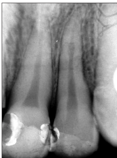
Obr. 10. RTG zubu 12 – počínající vnitřní granulom v místě zhojené fraktury.

K tomuto výkonu se nedostavil a teprve po devíti letech se nám podařilo jej kontaktovat. Při RTG kontrole jsme resorptivní proces nenalezli (obr. 11), vitalita zubu byla pozitivní, poklep negativní a barva korunky shodná s ostatními zuby.