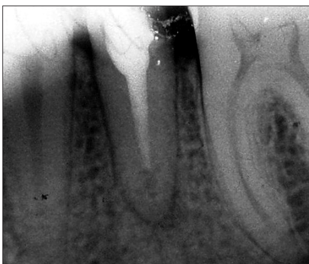
Obr. 6. RTG zuby 35 - nestejná radiální denzita u vnitřního granulomu v apikální třetině kořene.