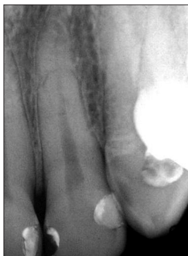
Obr. 11. RTG zubu 12 – vymizení resorptivního procesu (stav 9 let od diagnózy).

Obecně ale platí, že nejdůležitější podmínkou pro úspěšné ošetření zubu s vnitřním granulomem je včasná a dokonalá exstirpace zánětlivě změněné vitální dřeně [14]. Sami jsme sice zaznamenali výše uvedený případ spontánního zastavení a vymizení resorpce, ale ve shodě s ostatními autory ho považujeme za vzácný [7, 15]. Je to však důkaz přítomnosti apozičních pochodů v průběhu vývoje vnitřního granulomu, i když v naprosté většině případů nakonec převládá resorpce, vedoucí po různé dlouhé době ke ztrátě zubu.