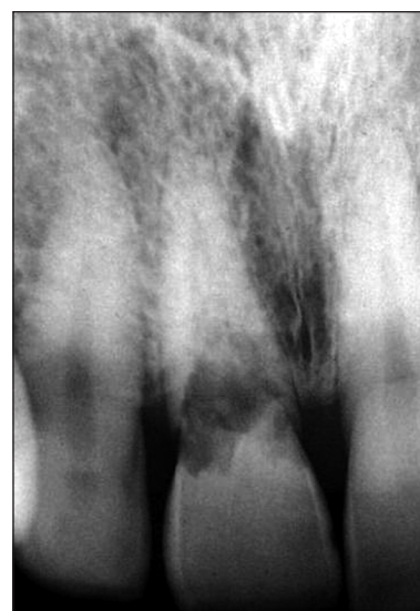
Obr. 8. RTG zuby 21 - vnitřní resorpce spolu se zevní v oblasti gingivální třetiny kořene v době stanovení diagnózy.

Velmi zajímavým aspektem je u vnitřního granulomu vývoj patogeneze resorptivního procesu bez léčebného zásahu, který dokumentujeme na dvou případech [15]. V prvním se jedná o ženu, u které byla diagnostikována vnitřní resorpce spolu se zevní v oblasti gingivální třetiny kořene zuby 21 (obr. 8). V anamnéze uváděla úraz v dětství. Pacientka byla bez potíží, reakce na poklep byla negativní, reakce na chlad neprůkazná. Vzhledem k rozsahu resorpce a s přihlédnutím k přání pacientky bylo upuštěno od jakéhokoliv zásahu. Léčebný pokus by s největší pravděpodobností vedl k takovému oslabení klinické korunky, že by její fraktura byla nevyhnutelná a zub tak byl odsouzen k extrakci. Zub 21 byl pouze rentgenologicky kontrolován. Ke spontánní fraktuře došlo až po osmnácti letech, v korunkové části nebyly patrné žádné diskolorace (obr. 9).