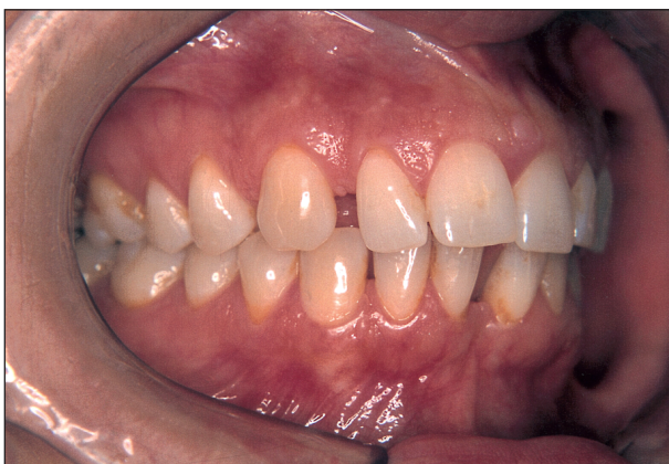
Obr. 1. Nápadné trema mezi 2 + a 3 + působí rušivě při úsměvu.

Tř. Angle I, meziální inklinace 1+, trema v pra-