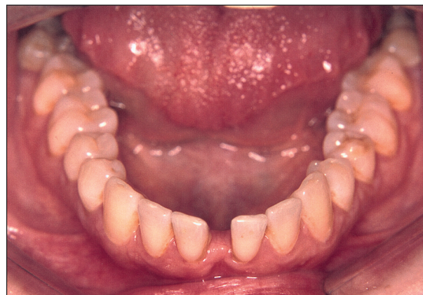
Obr. 2. Esteticky hendikepující diastema mezi dolními středními řezáky v šířce 7 mm.

vém horním frontálním úseku, diastema 1 - 1 v šířce 7 mm (obr. 2).