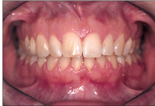
Obr. 5. Adhezivní můstek malého rozsahu zhotovený po ortodontickém předlčení (otevření mezery) esteticky i funkčně rehabilitoval trema ve viditelném úseku chrupu. Stav po ukončení léčby, foto v den sejmutí dolního fixního aparátu.

Uzavírání mezer, popřípadě jejich protetické dořešení, je jednou z úspěšných variant komplex-