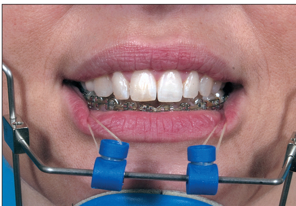
Obr. 4. Dorzoventrální tahy kotvené na trny stavitelného oblouku Delairovy masky navozují meziální posun zubů dolních laterálních úseků. Detailní pohled.

v postavení molárů i špičáků ve tř. Angle I (obr. 3, obr. 4, obr. 5).