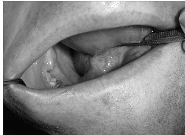
Obr. 1. Obnažení kosti alveolárního výběžku dolní čelisti.

Extrakce zubu se komplikovala alveolitidou bez hnisavé exsudace. Ta vzdorovala běžné terapii, docházelo k rozsáhlejšímu obnažení kosti (obr. 1) v začátku s výraznou bolestivostí, později