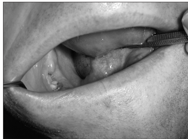
Obr. 1. Obnažení kosti alveolárního výběžku dolní čelisti.

Extrakce zubu se komplikovala alveolitidou bez hnisavé exsudace. Ta vzdorovala běžné terapii, docházelo k rozsáhlejšímu obnažení kosti (obr. 1) v začátku s výraznou bolestivostí, později