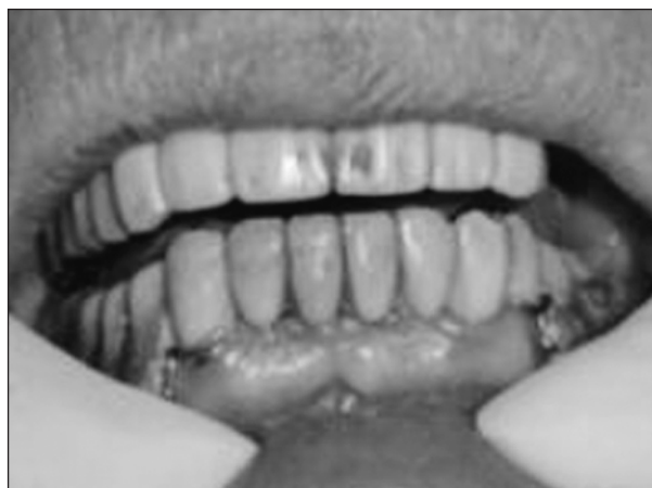
Obr. 4. Plastem fazetovaný můstek 22, 23, 24 po 3 letech, marginální gingiva bez známek zánětu.