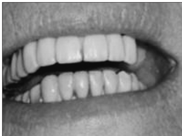
Obr. 5. Palatinální abraze 13, 14 a okluzální abraze 33 v důsledku přímého kontaktu s antagonistem.