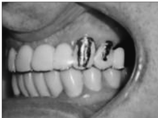
Obr. 3. Pacient kuřák, 4 roky starý můstek s plastovými fazetami s výraznými pigmentacemi (3a). Stav po vyleštění (3b).

rastrovacím mikroskopu, že se zde při zhoršené hygieně snadno usazuje zubní povlak. Gingiva proto snadněji než u intaktních zubů reaguje