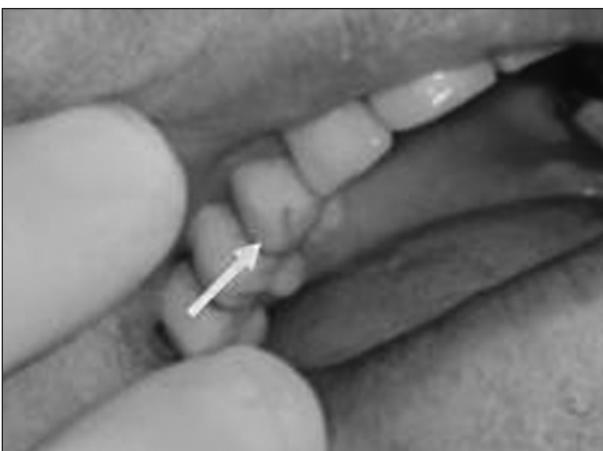
Obr. 2. 17 let starý plastem fazetovaný můstek s pokročilou abrazí vestibulárních fazet.

Stupňující se abraze fazetových korunek během žvýkání nebo hyperfunkce nebo též jako následek špatné techniky čištění zubů, mohou vést ke snížení výšky skusu, změně tvaru a velikosti náhrady [10, 16]. Jakákoli dentální struktura, která je permanentně deformována nadměrnými kousacími tlaky, je vyražena ze řádného okluzního vztahu, pro který byla původně plánována, náhrada se stává permanentně deformovanou a může být proto vystavena většímu tlaku než původně vytvořená náhrada, což snižuje i její mechanickou odolnost. Obvykle v takových podmínkách se neobjevuje porušení povrchu, ale znásobuje se permanentní deformace [14]. Deformace korunky a změny v její struktuře mohou zapříčinit také problémy při čištění zubů [10] (obr. 2).