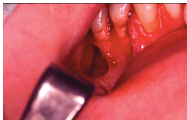
Obr. 4. Dutina v kosti po extirpaci cysty.

Fig. 2. A pouch of the cyst after uncovering the mucoperiosteal lobe.