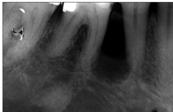
Obr. 3. Cystické projasnění mezi kořeny zubů 46, 45 na i.o. snímku.

Fig. 1. A tough, painless vaulting of alveolar process.