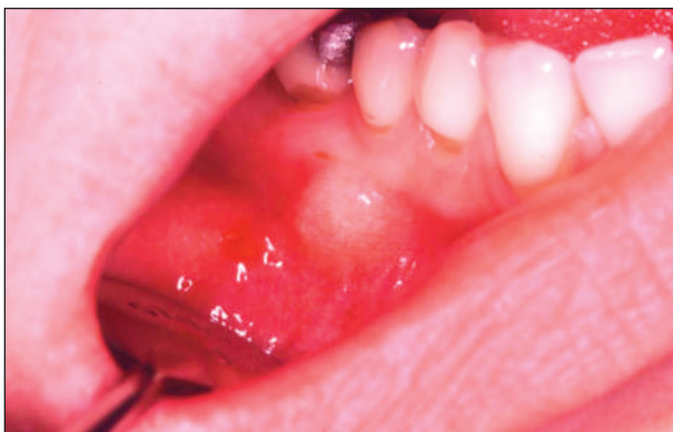
Obr. 1. Tuhé, nebolestivé vyklenutí alveolárního výběžku.

Fig. 1. A tough, painless vaulting of alveolar process.