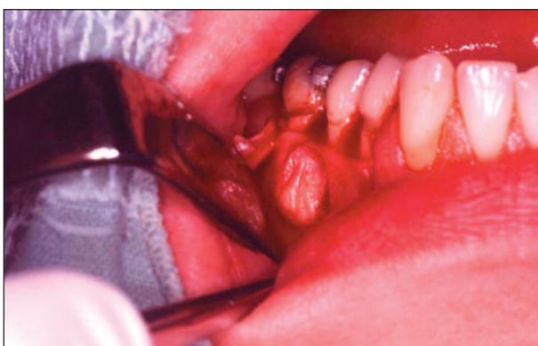
Obr. 2. Vak cysty po odklopení mukoperiostálního laloku.

Fig. 3. Cystic brightening between roots of the teeth 46, 45 on i.o. picture.