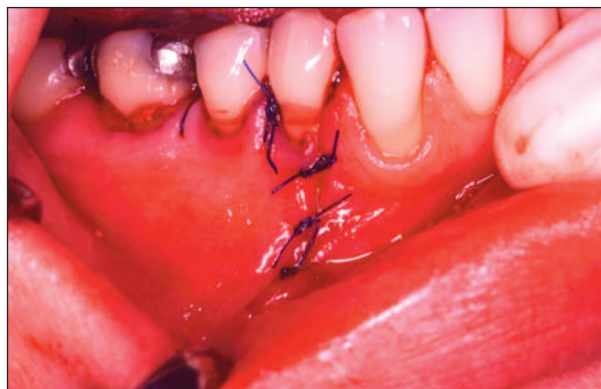
Obr. 7. Stav po repozici a sutuře mukoperiostálního laloku.

Fig. 5. Cystic cavity filled with augmenting material Poresorb.