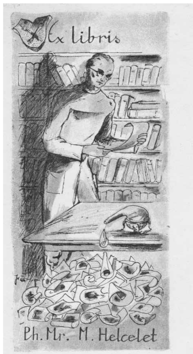
Obr. 3. Knižní značka Mojmíra Helceleta – farmaceutické exlibris (Jiří Vláčil, autotypie, 1944, Památník písemnictví na Moravě)