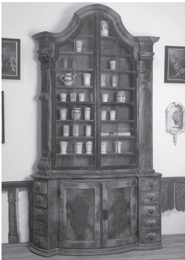
Obr. 4. Čelo zásuvky z lékárenské skříně pro uložení zázvoru

může být překvapující výběr ze dvou druhů léčivých aloe, z nichž byla dražší Aloe vera , Aloe succotrina (v inventáři (dále jen zkratka inv.) Aloe succotrin. , 1¼ lb. (libra) za 1 zl. 45 kr.), užívaná již ve středověku jako prudké projímadlo 14 ). Proti kolice a bolesti 15 ) se využívaly dnes málo časté bobule vavřínu, baccae lauri (inv. baccar. laur. , 28 kr. za 3½ lb.). Dále u nejvíce ceněných položek najdeme zastoupení hřebíčku – Eugenia caryophyllata (inv. caryophil. , 1¼ lb. za 6 zl.), oblíbeného koření užívaného rovněž pro znečistlivění v rámci zubního lékařství. V inventáři jsou některá simplicia psána pohromadě dle typu nebo části rostliny (např. kůry, kořeny apod.), další jsou pak samostatně seřazeny dle abecedního pořádku. Ze skupiny kůr byla důležitým jezuitským artiklem především chinovníková kůra – cortex chinae (inv. cort. chinae ), dovážená z Nového světa. V Telči se množství 4 lb. cenilo na 6 zl. 48 kr. K prodeji byla dále kůra granátového jablka, cortex (inv. cort. Granati , ½ lb. za 8 kr.), guajaku léčivého – guaiacum officinale (inv. guajac , 3 lb. za 30 kr.) z Jižní Ameriky s účinky na kožní choroby a údajně i syfilis 16 ) a kašti (inv. sassafras , ½ lb. za 24 kr.). Kůra se využívala i ze stromů mandlovníků (inv. myrabol. , ½ lb. za 4 zl. 12 kr.), odebíraná až z pěti jeho druhů.