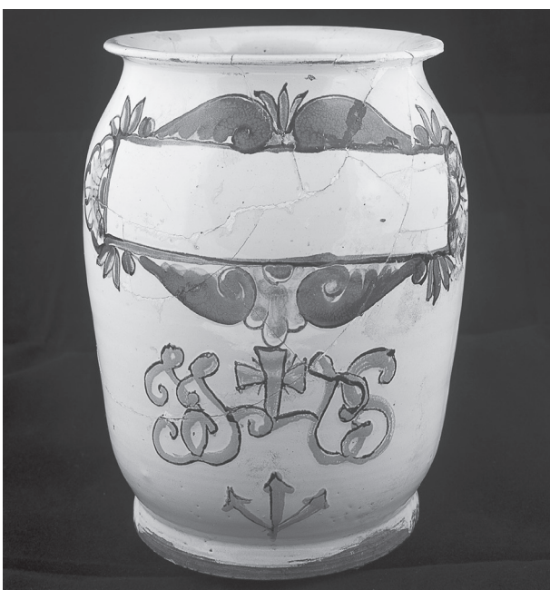
Obr. 7. Válcová stojatka s motivem IHS

(obr. 8) odkazující na rumělkou, lat. cinnabaris , užívanou jako červené barvivo. V inventáři byla v době uzavření lékárny zaznamenána v množství 2½ lb. a ¼ lb. v ceně 6 zl. 15 kr. a 38 kr. Tento typ nádob se obvykle užíval na masti, lektvary apod., které se uzavíraly kůží převázanou pod vystouplým okrajem 30 ). Obě nádoby odpovídají středoevropské tvorbě od konce 17. století 31 ), která se udržuje i v polovině a ve druhé polovině 18. století. Srovnat ji lze s nizozemskou produkcí konce 17. a první poloviny 18. století, běžně se vyskytovaly i nádoby německého 32 ) či italského původu 33 ). Stojatky nepochybně českého či slovenského původu mají však svůj vlastní charakter spjatý pravděpodobně s keramikou habánskou, která