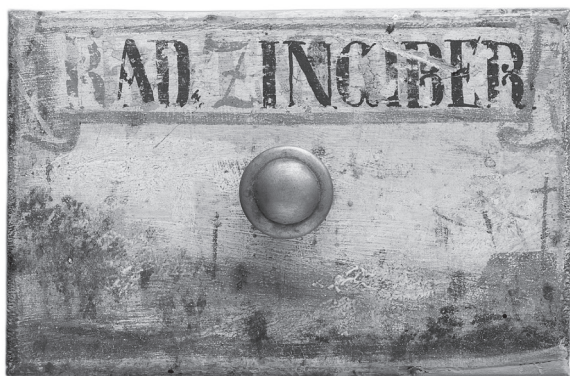
Obr. 3. Lékárenská skříň

K nejcennějším položkám rostlinných léčiv patřily dnes poměrně běžné části rostlin. Pro současného člověka