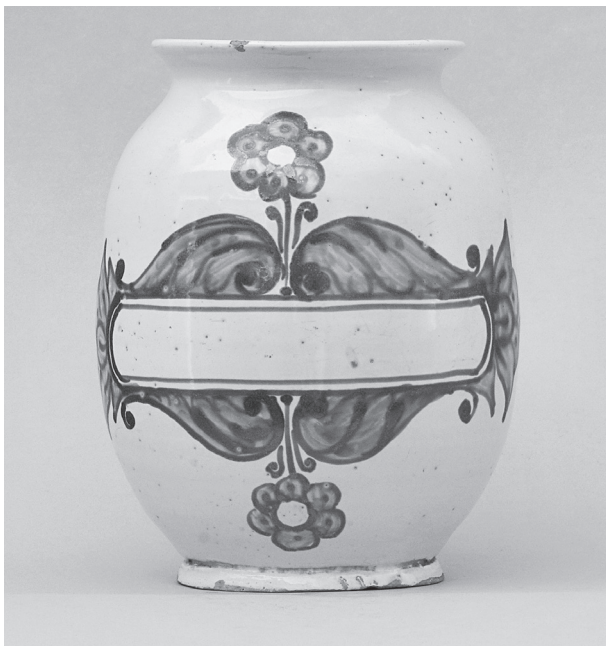
Obr. 6. Válcová stojatka

(obr. 8) odkazující na rumělkou, lat. cinnabaris , užívanou jako červené barvivo. V inventáři byla v době uzavření lékárny zaznamenána v množství 2½ lb. a ¼ lb. v ceně 6 zl. 15 kr. a 38 kr. Tento typ nádob se obvykle užíval na masti, lektvary apod., které se uzavíraly kůží převázanou pod vystouplým okrajem 30 ). Obě nádoby odpovídají středoevropské tvorbě od konce 17. století 31 ), která se udržuje i v polovině a ve druhé polovině 18. století. Srovnat ji lze s nizozemskou produkcí konce 17. a první poloviny 18. století, běžně se vyskytovaly i nádoby německého 32 ) či italského původu 33 ). Stojatky nepochybně českého či slovenského původu mají však svůj vlastní charakter spjatý pravděpodobně s keramikou habánskou, která