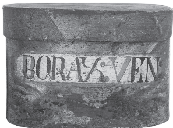
Obr. 15. Zásuvka lékárenské skříně na uchovávání listů seny