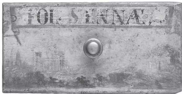
Obr. 14. Dýchová krabice na ukládání listů seny, pohled na zadní stranu