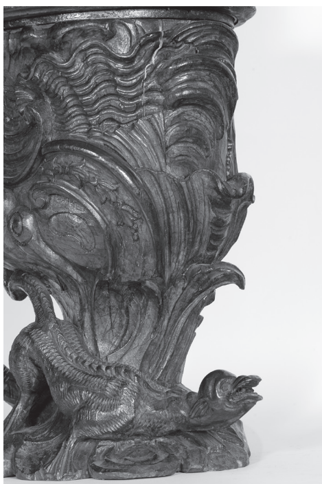
Obr. 11. Detail ještěra a nohy vyřezávané stojatky na theriak č. 1

Dřevěné stojatky reprezentují dvě velké vyřezávané nádoby nepravidelného tvaru. Ojedinelá díla zručného řezbáře sloužila pro uložení farmaceutického prostředku (obr. 9, 10). Noha je u paty zdobena dvěma mýtickými zvířaty s ploutvovitými končetinami, ještěřím tělem a otevřenou tlamou (obr. 11). Obě bytosti jsou situovány za sebou, přičemž první hledí k čelní straně a druhá k zadní části. Kalich tvoří soubor dekorativních motivů z rokaje, listoví a vejcovitých motivů, vrchol je zvýrazněn oblou římsou a završen bustou mladé ženy s rozpuštěnými vlasy, štítkem před hrudníkem a korunou na hlavě. Celkové pojetí je nesmírně dynamické, expresivní a detailně provedené. Druhá nádoba zachovává podobné