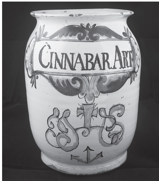
Obr. 8. Válcová stojatka s motivem IHS a nápisem „Cinnabar Art“

proudy evropské tvorby reflektovala. Obdobný styl s folkloristickými prvky v modré barvě kolem bílého nápisového rámce nalezneme ve sbírce hospitalu Kuks, tamější nádoba vzešla z dílny habánských mistrů 34 ) a pochází z konce 17. století 35 ). Rovněž u telčských kusů je možné předpokládat dle dohledaných analogií jejich výrobu již v 17. století 36 ). Poslední keramická stojatka připomíná svým tvarem džbánek s útlým válcovým hrdlem a uchem. Přední část opět zdobí modrý rám lidového charakteru. Tvar nádoby je ve střední Evropě běžně užíván v léká-