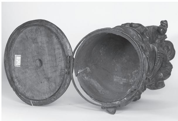
Obr. 10. Vyřezávaná stojatka na theriak č. 1, pohled na otevřenou nádobu a víko upevněné na obruči s pantem

renské praxi již od renesance 37) a sloužil pro uchovávání olejů nebo sirupů. Z hlediska stáří se pravděpodobně jedná o mladší kus z produkce některé lidové dílny.