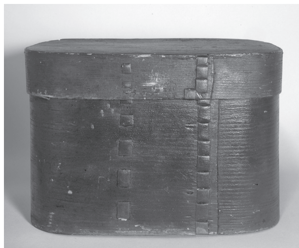
Obr. 13. Dýhová krabice na ukládání listů seny