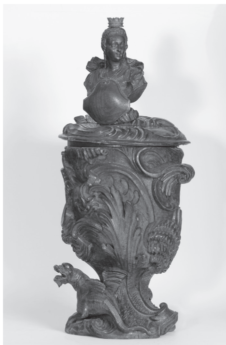
Obr. 9. Vyrovaná stojatka na theriak č. 2

proudy evropské tvorby reflektovala. Obdobný styl s folkloristickými prvky v modré barvě kolem bílého nápisového rámce nalezneme ve sbírce hospitalu Kuks, tamější nádoba vzešla z dílny habánských mistrů 34 ) a pochází z konce 17. století 35 ). Rovněž u telčských kusů je možné předpokládat dle dohledaných analogií jejich výrobu již v 17. století 36 ). Poslední keramická stojatka připomíná svým tvarem džbánek s útlým válcovým hrdlem a uchem. Přední část opět zdobí modrý rám lidového charakteru. Tvar nádoby je ve střední Evropě běžně užíván v léká-