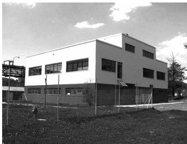
Obr. 3. Nový pavilon jakosti 20

Celkově po vlastnictví Chemapolu došlo ke stagnaci prodeje na úrovni přibližně 1 miliardy korun ročně, což vytvořilo velké ztráty a došlo k propadu Lachemy do červených čísel. Lachema je nucena přijmout pomoc od Plivy, ovšem, podle některých komentářů, s velkou mírou úrokových splátek 12 .