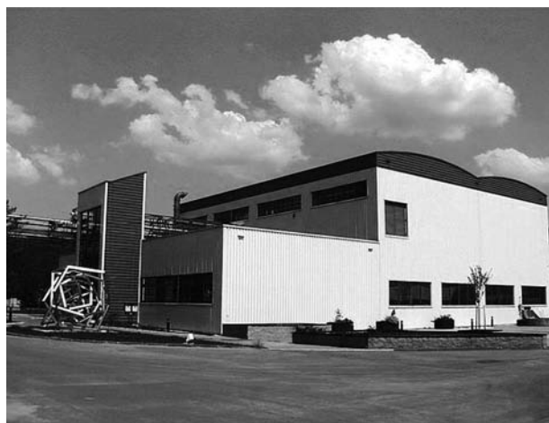
Obr. 4. Výrobna cytostatických injekcí 20