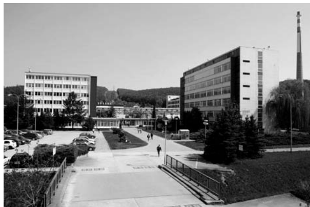
Obr. 5. Administrativní budova a Výzkumný ústav před likvidací firmy 9 )

násobku průměrné měsíční mzdy dle délky zaměstnání ve firmě 32 ). Drobní akcionáři, převážně z řad bývalých zaměstnanců, pak prodali své akcie většinovému vlastníkovi. Hospodaření Lachemy v roce 2008 skončilo historicky nejvyšší a poslední ztrátou ve výši 405 milionů 33 ) (graf 1).