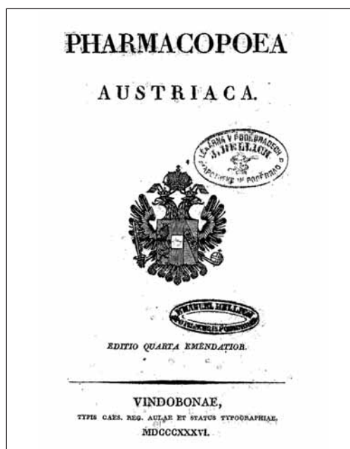
Obr. 1. Titulní stránka doplňené čtvrté vydání rakouského lékopisu z roku 1836

V červenci 1849 bylo vytvořeno samostatné ministerstvo vnitra a jeho ministrem se stal Alexander Bach. Při ministerstvu vznikla jako poradní orgán Stálá zdravotní komise, do jejíž náplně spadalo též vydávání lékopisu. V roce 1852 vyšel jeho návrh 7) a v roce 1854 byl připraven konečný text. Úvodní výnos ministerstva vnitra, podepsaný ministrem Bachem, je datován 20. října 1854 a byl napsán německy, což byla proti dřívějším vydáním novinka. Nařizuje se v něm, aby se všichni zdravotní úředníci, praktičtí lékaři, ranhojiči, veterináři a lékárníci dobře seznámili s obsahem nového lékopisu a řídili se jím. Závaznost nového lékopisu byla stanovena od 1. led-