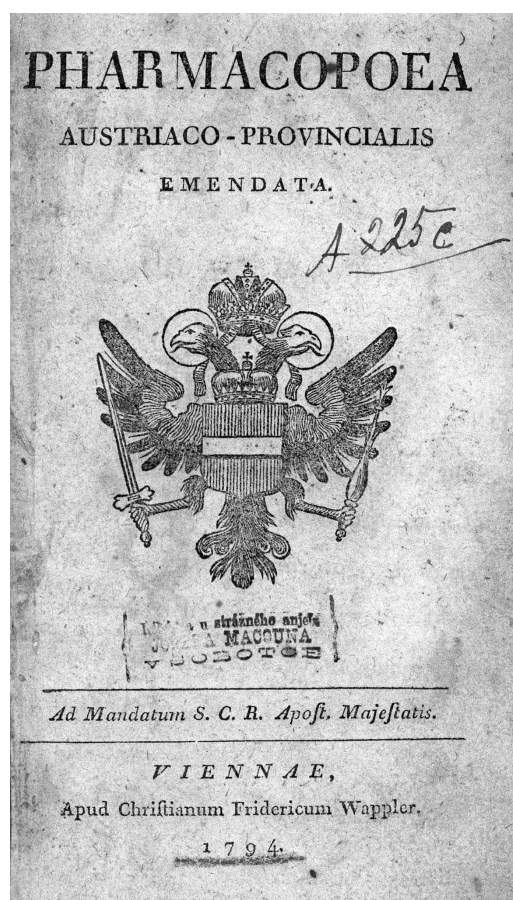
Obr. 1. Titulní stránka vydání lékopisu z roku 1794

Další tvarově specifickou formou byly Tabulae . Vídeňské dispensatorium obsahovalo dva druhy, z nichž provinciální lékopis převzal jen Tabulae de althaea . Připravovaly se smícháním jemně práškového proskurníkového kořene s cukrem a tragantovým slizem. Vzniklá