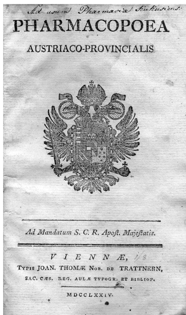
Obr. 1. Titulní list lékopisu z roku 1774

Složení galenických přípravků autoři obvykle upravili a vypustili z něho ty látky, které v daném přípravku nepovažovali za důležité. Někdy také pozměnili způsob přípravy a případně též upravili název článku. Opustili původní rozdělení článků do tříd podle lékových forem a seřadili články podle abecedy. Navíc do provinciálního lékopisu zařadili nové statě, např. soupis používaných léčivých a pomocných látek ( Materia pharmaceutica , v pozdějších vydáních přejmenovaný na Materia medi-