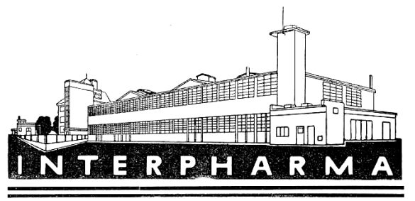
Obr. 1. Interpharma, společnost pro výrobu a prodej chemických a farmaceutických preparátů spol s r.o.

„Interpharma, společnost pro výrobu a prodej chemických a farmaceutických preparátů spol s r.o.“ byla založena v roce 1932 (obr. 1). Účelem firmy Interpharma byla laboratorní výroba syntetických léčiv, která k nám do té doby byla dovážena zejména z Německa a ze Švýcarska. Obrat společnosti byl v prvních letech malý, protože k těmto úkolům společnost prováděla i rozsáhlý klinický a chemicko-technologický výzkum a značné propagační akce v lékařských kruzích. Soudobý odborný tisk tu skutečnost zaznamenal následovně: „Nová společnost pro výrobu léčiv. Před půl rokem se založila spo-