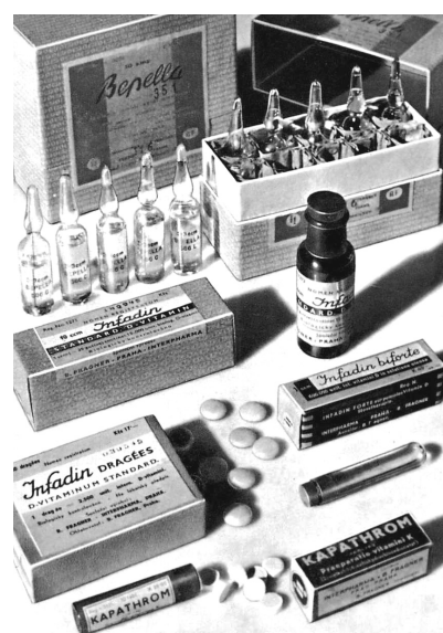
Obr. 4. Infadin

„Vitamins. Nástin významu a terapeutického upotřebení vitaminů v lékařské praxi“, která vyšla v roce 1939. Další knihou, kterou vydala firma Interpharma, je publikace „Hormony ženského cyklu „Interpharma“. Obě knihy sloužily jako pozornosti pro lékaře, jsou dostupné v archivu Českého farmaceutického muzea v Kuksu.