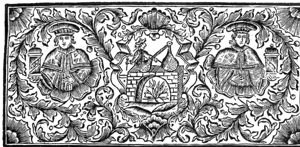
Obr. 2. Patroni lékařů a lékárníků svatí Kosma a Damián v záhlaví předmluvy Obnoveného pražského farmaceutického dispensatoria

lení látky z vídeňského dispensatoria 6) a uvedlo ji v devatenácti třídách ( classis ), rozdělených podle lékových forem. Někdy se také text určitých článků shoduje s textem vídeňského dispensatoria. Druhé vydání se od prvního liší výběrem látky a často i názvoslovím. Nepřevzalo údaje o indikaci a používání, které jsou uvedeny v prvním vydání i ve vídeňském dispensatoriu. Z prvního vydání nepřevzalo ani většinu poznámek k jednotlivým přípravkům. Detailní porovnání obou pražských vydání by si proto vyžádalo samostatnou srovnávací studii.