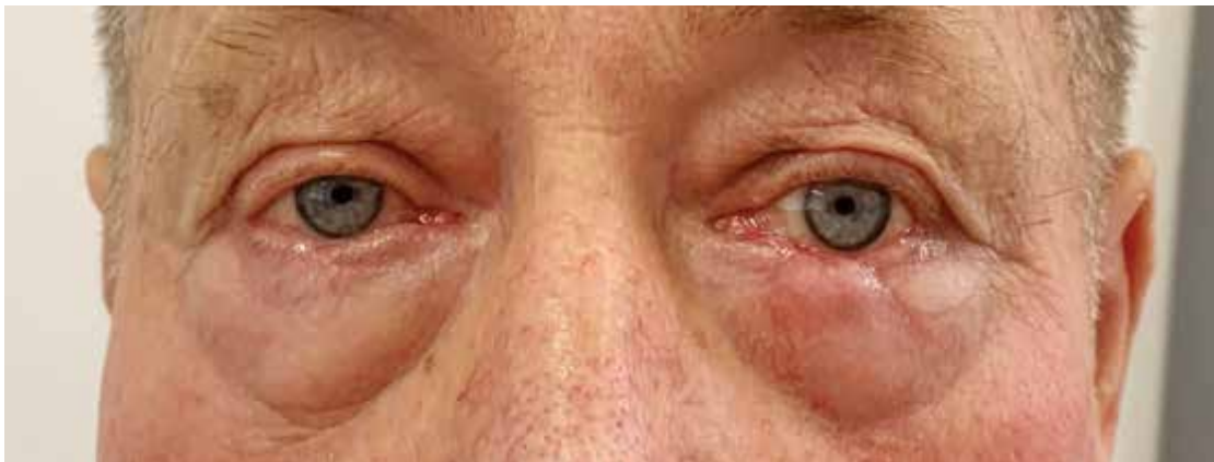
Obrázek 4. Nález na poslední kontrole – stav po rozdělení Hughesova laloku vlevo, vpravo po resekcii KS s rekonstrukcí v jedné době

Histopatologické vyšetření biopsického vzorku z levého horního víčka neprokázalo maligní struktury, také bylo potvrzeno, že Kaposiho sarkom z pravého dolního víčka byl odstraněn s negativním bezpečnostním lem. Bylo naplánováno rozdělení Hughesova laloku vlevo. Plánované rozdělení Hughesova laloku na levém oku proběhlo zcela bez komplikací, onkologicky nebyla doporučena adjuvantní radioterapie v oblasti očí pro lokalitu a provedenou R0 resekci. Při poslední kontrole na Oční klinice FNO byl přední segment klidný a pacient byl předán ke sledování svému spádovému očnímu lékaři. Obrázek 4.