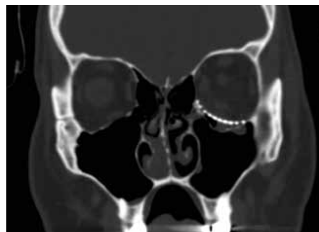
Obrázok 8. Pooperačné CT zobrazenie rekonštrukcie spodiny očnice titánovou mriežkou - koronárny rez