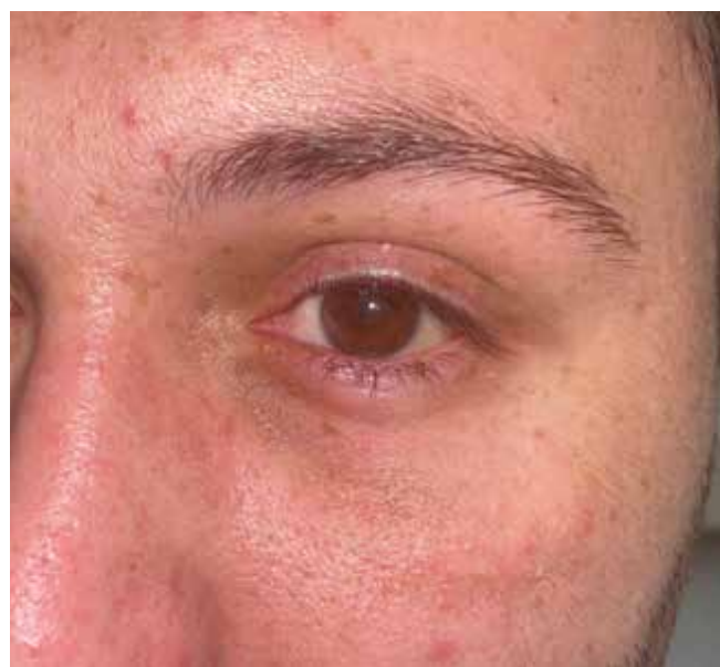
Obrázok 6. Klinický nález 6 týždňov po rekonštrukcii spodiny očnice