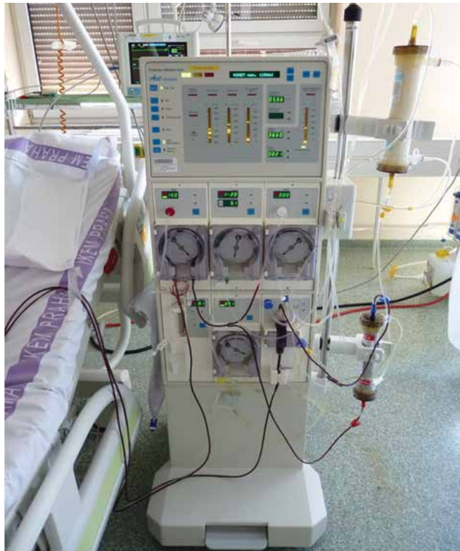
Obrázek 1. Aferetický přístroj nasetovaný na rheoferézu. Dole membránový filtr oddělující plazmu od krevních elementů, nahoře rheoferetický filtr vylučující makromolekuly. K posteli přichyceny setové linky mimotělního oběhu odvádějící z pacienta a vracející plnou krev zpět do oběhu pacienta

ronektinu [2]. Dochází ke snížení aktivity všech tří drah komplementu. To vede ke zlepšení viskozity krve a plazmy, ke snížení agregace erytrocytů. Nezávisle na základní chorobě dochází ke zlepšení mikrocirkulace. Fibrinogen a další globuliny, jako např. \alpha_2 -makroglobulin, jsou determinanty krevní viskozity a slouží jako makromolekulár-