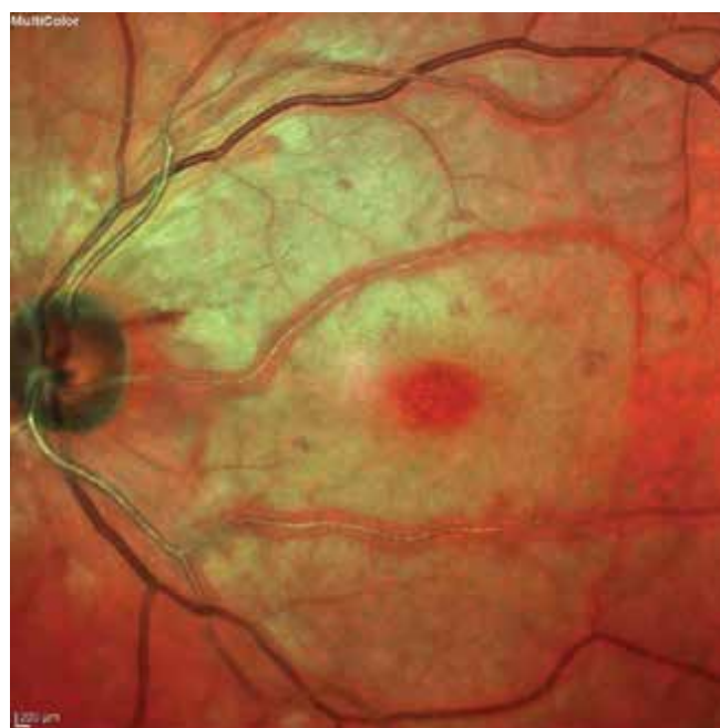
Obrázek 1. Bledý vzhled sítnice s třešňovou skvrnou v makule – příznaky CRAO trvajících 6,5 hodiny CRAO – central retinal artery occlusion

Po několika týdnech od okluze je možné zaznamenat atrofii optického nervu a přítomnost cilioretinálních kolaterál. U 18 % pacientů se do pěti měsíců od okluze rozvíjí