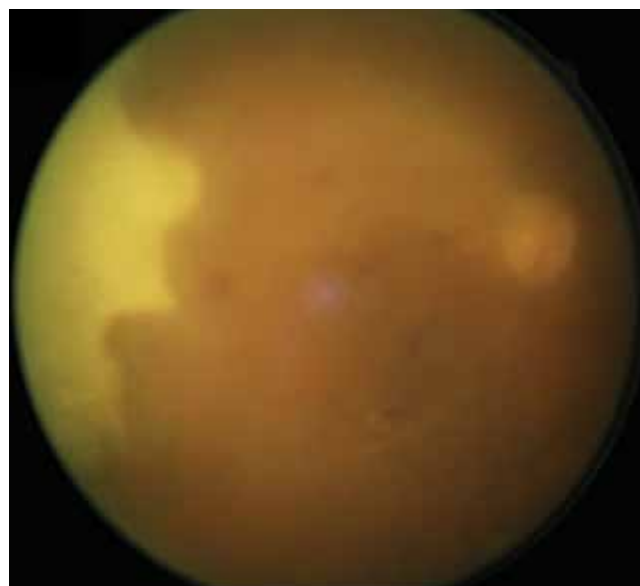
Obrázok 2. Fotografia očného pozadia pravého oka: pre zápalovú aktivitu v sklovci vidno matnejšie zneostrený zrakový nerv, okludované cievy, v temporálnom kvadrante žltobiele ložisko nekrózy