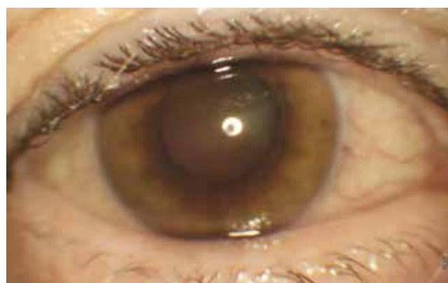
Obrázok 1. Fotografia predného segmentu pravého oka: absencia červeného reflexu, precipitáty na endoteli rohovky a prednom púzdre šošovky

prečítal 66 a 65 písmen, CRT bola 327 a 335 \mu\text{m} a vnútroočný tlak bol 20 mmHg bilaterálne. Došlo k poklesu edému makuly a ostatný očný nález bol bilaterálne bez zmeny v porovnaní s nálezom pred aplikáciou Ozurdexu®. Neboli prítomné známky zápalu a bola doplnená fokálna laserkoagulácia periférie sietnice oboch očí. Približne 3,5 mesiaca od aplikácie do pravého oka (presne 74 dní) pacient prichádza pre 10 dní trvajúce, neboleslivé zhoršenie zrakovkej ostrosti na pravom oku. Popisoval mierne zastretý obraz a prečítal 60 písmen ETDRS. Na prednom segmente bol obraz granulomatóznej prednej uveitídy (Obrázok 1). V kavite sklovca vidno tyndalizáciu zápalových buniek a formované opacity. Na očnom pozadí nachádzame zneostrený zrakový nerv, okluzívnu vaskulitídu a v periférii v temporálnom kvadrante žltobiele relatívne ostroohraničené ložisko nekrózy (Obrázok 2). Na OCT je prítomný diskretný makulárny edém, na po-