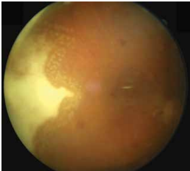
Obrázok 5. Fotografia očného pozadia pravého oka mesiac po pars plana vitrektómii

vrchu sietnice a zadnej sklovcevej membrány sú hrudky hyperdenzného materiálu (Obrázok 3).