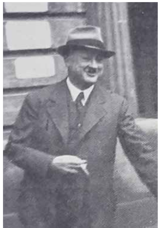
Obrázek 5. Prof. MUDr. B. Slavík [10]