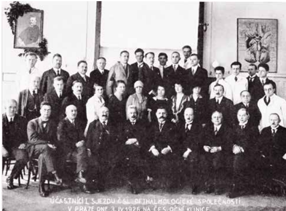
Obrázek 3. Účastníci sjezdu Čsl. Oftalmologické společnosti v Praze dne 3.4.1926 na české Oční klinice [7]

až do roku 1938, kdy se koncem června konal XIII. Sjezd společnosti v Praze, již v dusném prostředí napjaté mezinárodní situace. Jak se potom drobilo území našeho státu, život se před očima rozplýval a zbyla nás jen malá hrstka, vzrůstalo mlčení i ve strádajících pracovnách.“