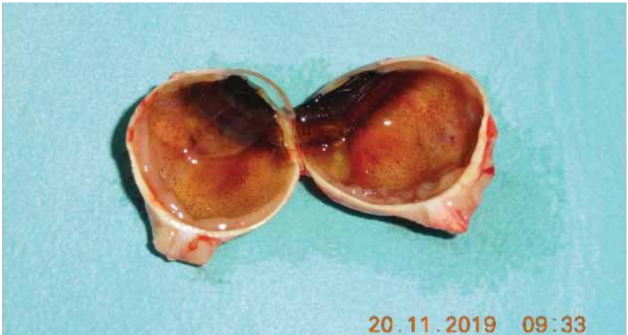
Obrázok 2.: Bulbus po enukleácii: intrabulbárna masa 2x1 cm s cirkulárnym prerastaním okolo zrkovového nervu

teľná amočná odozva vo všetkých kvadrantoch, odlúčenie choroidey, terč zrkovového nervu prekrytý tumorom, rozšírenie zrkovového nervu a negatívne echo v hrúbke 5mm. Magnetická rezonancia preukázala nepravidelné zhrubnutie steny ľavého bulbu, obraz plošného zhrubnutia choroidey do hrúbky 2,8 mm, prítomné retrobulbárne šírenie v okolí terča zrkovového nervu a iniciálneho úseku zrkovového nervu s rozmermi 14x5,5 mm a obraz plošnej amócie sietnice. Mozgový parenchým bol na magnetickej rezonancii intaktný. Vyšetrenie optickou koherentnou tomografiou nebolo možné zrealizovať, pacientka nefixovala ľavým okom. Fluoresceínová angiografia nebola realizovaná pre jednoznačný nález tumorózneho intraokulárneho ložiska s postihnutím iniciálneho úseku zrkovového nervu na ultrasonografii