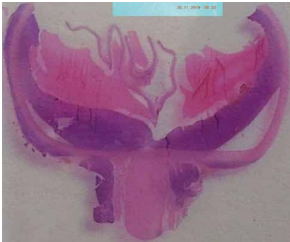
Obrázok 3.: Histologický nález: tumor na zadnej stene bulbu pod cievkou a retrobulbárna infiltrácia okolo zrakového nervu

infiltrácia malými lymfocytmi s jadrom okrúhlym alebo s mierne poprehýbanou jadrovou membránou, hrudkovitým chromatínom, centrálnym jadričkom, malým množstvom cytoplazmy, s tvorbou zárodočných / proliferáčnych centier, mitotická aktivita je nízka. Rovnaká infiltrácia bola aj v retrobulbárnom tkanive po stranách zrakového nervu.