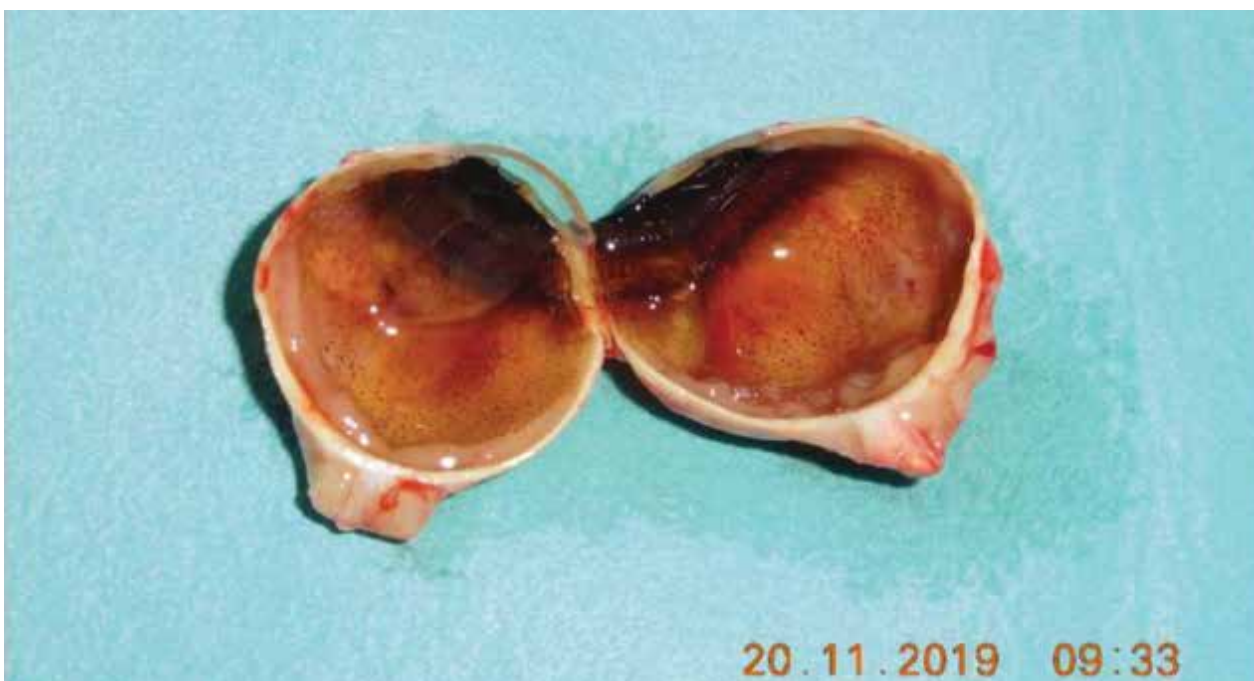
Obrázok 2.: Bulbus po enukleácii: intrabulbárna masa 2x1 cm s cirkulárnym prerastaním okolo zrkovného nervu

teľná amočná odozva vo všetkých kvadrantoch, odlúčenie choroidey, terč zrkovného nervu prekrytý tumorom, rozšírenie zrkovného nervu a negatívne echo v hrúbke 5mm. Magnetická rezonancia preukázala nepravidelné zhrubnutie steny ľavého bulbu, obraz plošného zhrubnutia choroidey do hrúbky 2,8 mm, prítomné retrobulbárne šírenie v okolí terča zrkovného nervu a iniciálneho úseku zrkovného nervu s rozmermi 14x5,5 mm a obraz plošnej amócie sietnice. Mozgový parenchým bol na magnetickej rezonancii intaktný. Vyšetrenie optickou koherentnou tomografiou nebolo možné zrealizovať, pacientka nefixovala ľavým okom. Fluoresceínová angiografia nebola realizovaná pre jednoznačný nález tumorózneho intraokulárneho ložiska s postihnutím iniciálneho úseku zrkovného nervu na ultrasonografii