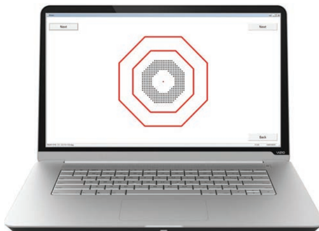
Obrázek 1. Testové rozhraní při testování metamorfopsií v programu D Chart

Kvantifikace metamorfopsie tedy může pomoci zhodnotit zlepšení zrakových funkcí pacienta a pomoci vybrat vhodného pacienta pro operaci. To vedlo autory k vývoji testu nazvaného D Chart, který je možné použít před operací i po operaci u pacientů s nízkou zrakovou ostrostí pro kvantitativní zhodnocení jejich metamorfopsie [7]. V původním provedení byl test v podobě papírových kartiček. Na kartičkách byly vytištěné prstence tvořené malými testovými čtverci kolem centrální fixační značky. Prstence měly různý poloměr. Vzdálenost jednotlivých čtverců rozmístěných do pravidelné mřížky byla od 0,4^\circ do 1,8^\circ . Pacient měl za úkol v každém z celkem osmi sektorů prstence označit místo, kde se mu mřížka zdála pokřivená. Suma maximální vzdálenosti mezi čtverci z každého sektoru a pro každou velikost prstence, při které viděl pacient mřížku ještě pokřivenou, tvoří celkové skóre metamorfopsie (M-skóre). V pilotní studii [7] byl prokázán pokles mediánu celkového M-skóre u pacientů před operací a po operaci