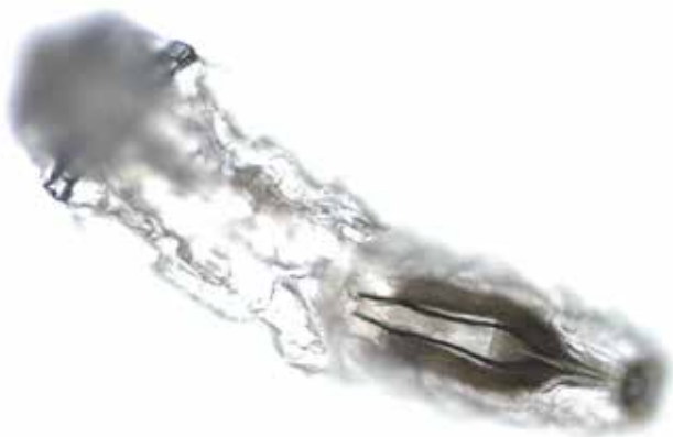
Obrázek 9. Larva Oestrus ovis z ventrálního pohledu (zvětšení 100x) s detailem vnitřních orgánů

mimo endemické oblasti, aby se zabránilo rozvoji mouchy v nových regionech, kde se dříve nevyskytovaly [7].