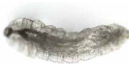
Obrázek 4. Larva Oestrus ovis (zvětšení 100x, Nikon Eclipse)