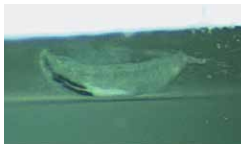
Obrázek 3. Uložený jedinec larvy Oestrus ovis ve Formolu focený na šterbinové lampě

Popisujeme případ očního onemocnění u muže středního věku z Čech, jenž trávil letní dovolenou sedm týdnů před vyšetřením na severu Řecka. V pozdních večerních hodinách v posledním srpnovém týdnu roku 2019 navštívil pacient oční pohotovostní službu. Údajně mu do levého oka vletly piliny, oko slzelo a bolelo. Kromě drobné eroze epitelu rohovky a lehce překrvené spojivky se zvláště ve vnitřním koutku a při podrobnějším vyšetření po celém povrchu bulbární spojivky i ve fornixech rychle pohybovalo v slzném filmu vlnivým pohybem přes dvacet podlouhlých 1,5–2 mm velikých světlých mikroorganismů s tmavým rostrálním koncem (oči a orgány)