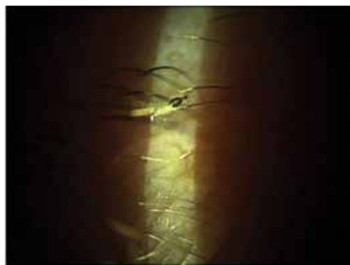
Obrázek 7. Jedinec larvy Oestrus ovis na víčkovém okraji

Při rutinním vyšetření na štěrbinové lampě vykazuje Oestrus ovis negativní fototaxi, malé a průsvitné larvy se pohybují dosti rychle pryč od jasného světla, což může při jejich přehlédnutí vést k nesprávné diagnóze stavu. Morfologické vlastnosti larvy Oestrus ovis jsou poměrně typické (Obrázky 8 a 9), ale mohou se lišit a je doporučováno molekulární ověřovací testování [12]. To však bylo jen zřídka aplikováno v humánní medicíně [13]. Z hlediska veřejného zdraví, je také důležité vzhledem k rychlé diagnostice humánních a veterinárních případů myiasis