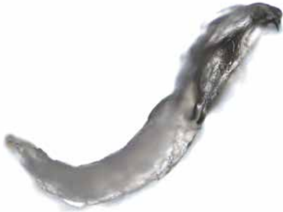
Obrázek 8. Larva Oestrus ovis z boku (zvětšení 100x) - dobře patrné oči a jeden háček