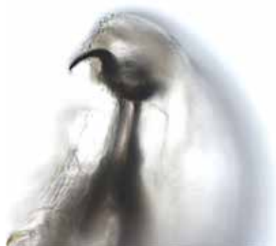
Obrázek 5. Detail pravého rostrálního háčku larvy Oestrus ovis při pohledu z ventrální strany (200x zvětšení)

S myiasou se v našich klimatických podmínkách pravděpodobně můžeme setkat u cestovatelů do jižních krajů po návratu z oblastí s velkým počtem ovcí a tím i střečků. V zemích non-endemických může představovat diagnostickou výzvu pro lékaře neseznámeného s tímto zamořením, obzvláště pokud jsou postiženy jiné orgány než kůže [7]. Napadení člověka střečkem je udáváno v případě nárazu plodné samice do pacientova oka a jeho okolí. Bývá to hlášeno pastýři ovcí a na venkově ve Středomoří, tropických a subtropických zemích [8].