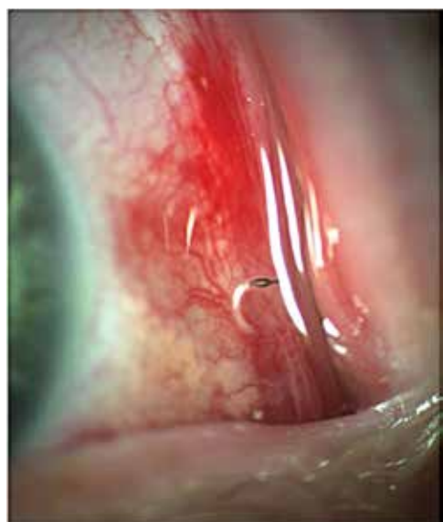
Obrázek 2. Velmi rychle se pohybující živí jedinci se dají obtížně fotošterbinou zachytit

a rohovky. Nejčastěji se projevuje jako akutní katarální konjunktivitida s nespecifickými příznaky pocitu cizího tělesa, slzení, fotofobie, erytém a event. periokulární edém. Projevy jsou obvykle krátkodobé a samolimitující, protože larvy se nemohou dále vyvíjet a umírají do 10 dnů. 2. vnitřní ophthalmomyiáza, kdy larvy pronikají do oční bulvy, jsou patrné v komorové vodě, v duhovkovém, sklivcovém nebo subretinálním prostoru, vzácně může způsobit zrak ohrožující endoftalmitidu a optickou atrofii. 3. orbitální ophthalmomyiáza: larvy pronikají do orbity a postihují adnexa a zrakový nerv [3]. Larvy Oestrus ovis však nejsou schopny vylučovat proteolytické enzymy, proto jsou většinou omezeny na vnější povrch oka [4]. V literatuře jsou uváděny vzácné případy komplikací jako jsou: podspojivkové krvácení (Obrázek 2), vřed rohovky, zhoršený zrak, intraokulární invaze s endoftalmitidou, iridocyklitida a dokonce slepota [5].