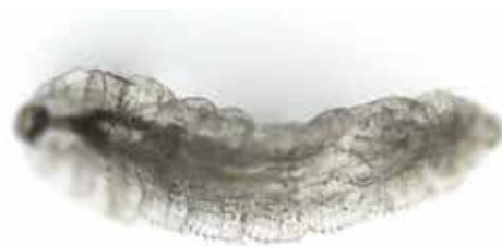
Obrázek 4. Larva Oestrus ovis (zvětšení 100x, Nikon Eclipse)