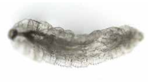
Obrázek 4. Larva Oestrus ovis (zvětšení 100x, Nikon Eclipse)