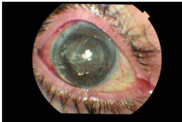
Obrázek 1a. Obrázek předního segmentu u pacienta 1 hodinu po 5-FU fakotrabekulektomii s intrakamerální injekcí triamcinolon acetonidu (TA)

loplastiku a pacienti, kteří byli sledováni po dobu kratší než 3 měsíce. Pacienti, u kterých došlo pooperačně k ruptuře zadního pouzdra nebo ztrátě sklivce, byli také vyloučeni.