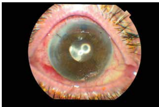
Obrázek 1b. Obrázek předního segmentu v 1. den ukazující triamcinolon acetonid (TA) na povrchu duhovky a endotelu rohovky