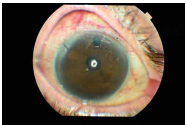
Obrázek 1c. Obrázek předního segmentu v 1. týdnu ukazující téměř úplné vymizení triamcinolon acetonidu (TA) z přední komory