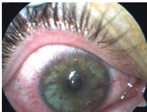
Obrázek 2. Pravé oko u pacientky z kazuistiky 1, viditelná smíšená vaskularizace rohovky