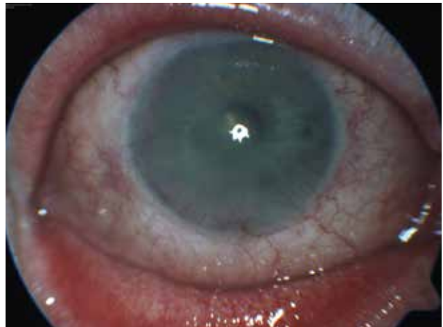
Obrázek 5. Pravé oko u pacientky z kazuistiky 2 se smíšenou injekcí spojivky, semitransparentní rohovkou a perilimální povrchovou i hlubokou vaskularizací rohovky

Dvaasedmdesátiletá žena byla odeslána spádovým očním lékařem pro oboustrannou keratitidu při celkovém onemocnění rosacea, se kterou se léčila od roku 2016.