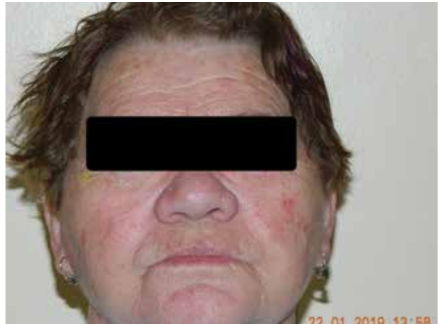
Obrázek 4. Obličej pacientky z kazuistiky 2 s dlouhodobě dobře léčenou rosaceou obličeje s ojedinělými aktinickými keratózami