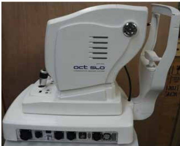
Obrázek 1. Přístroj Spectral Optical Coherence Tomography

Podle některých studií [5] je možné u spectral domain OCT dosáhnout sensitivity až 96 % a specificity 76 %. Cílem naší retrospektivní studie bylo vyhodnotit data získaná díky RNFL analýze ve 4 sledovaných souhrnných kvadran-