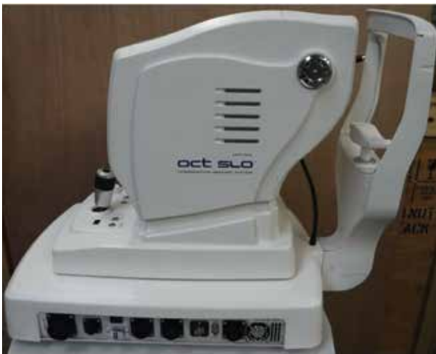
Obrázek 1. Přístroj Spectral Optical Coherence Tomography

Podle některých studií [5] je možné u spectral domain OCT dosáhnout sensitivity až 96 % a specificity 76 %. Cílem naší retrospektivní studie bylo vyhodnotit data získaná díky RNFL analýze ve 4 sledovaných souhrnných kvadran-