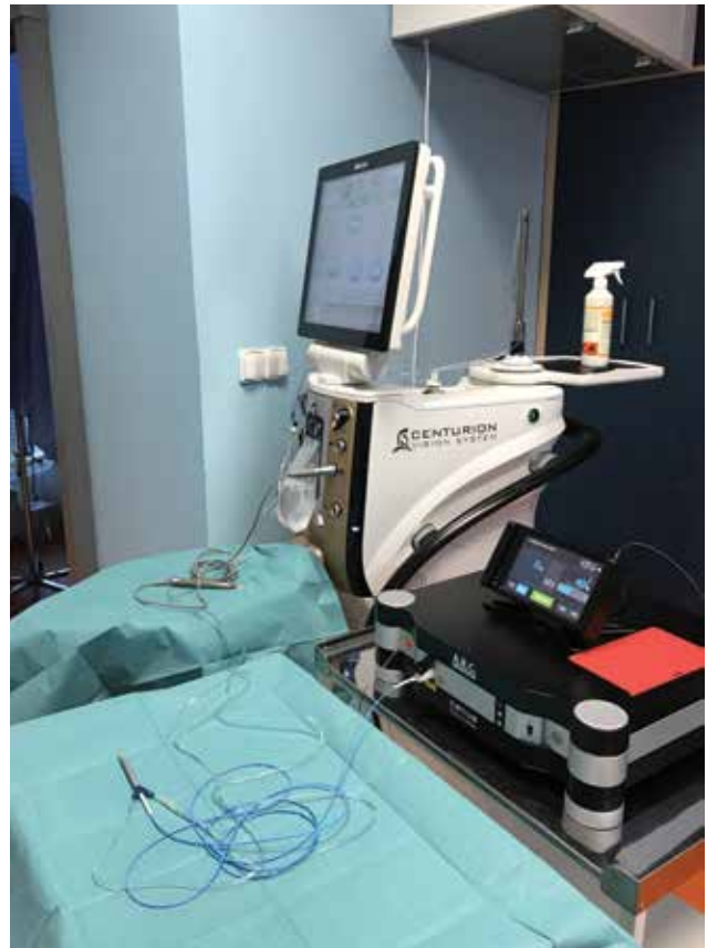
Obrázok 3. Pohľad na spojenie oboch prístrojov

Priemerné percento hexagonálnych buniek pred operáciou bolo v skupine I. 71,25 \pm 3,79\% , v skupine II. 69,75 \pm 4,35\% . Týždeň po operácii to bolo v skupine I. 68,50 \pm 4,52\% a v skupine II. 68,42 \pm 5,66\% . Zmeny boli v jed-