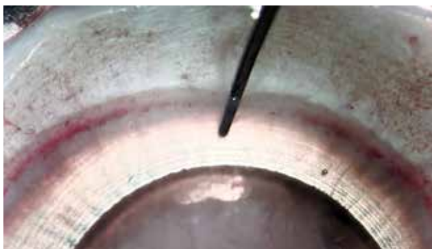
Obrázek 1. Otvor vytvořený pod DM před oddělením pomocí kapalinové bubliny

Zadní lamelární keratoplastika Descemetové membrány s endotelem (DMEK), kdy je transplantována pouze tenká Descemetová membrána (DM) s vrstvou endotelu se stává stále více populární pro chirurgické řešení Fuchsovy dystrofie a bulózní keratopatie [8] a je u těchto indikací považována za metodu volby. Separace DMEK štěpu je obvykle provedena opatrným seškrábnutím a sloupnutím DM z dárcovské rohovky [1,6]. Tento proces je časově náročný, vyžaduje vysokou zručnost a přináší nemalé riziko protržení membrány [2,8,15]. Nedávno se objevily nové metody, u kterých dochází k oddělení DM pomocí vzduchu/tekutiny injikované mezi DM a rohovkové stroma [9,13,14,16]. Přímé kapalinové oddělení pomocí jehly zasunuté mezi DM a rohovkové stroma je rychlý a jednoduchý způsob, který minimalizuje riziko roztržení membrány [11,16]. Navíc v průběhu oddělení pomocí kapaliny