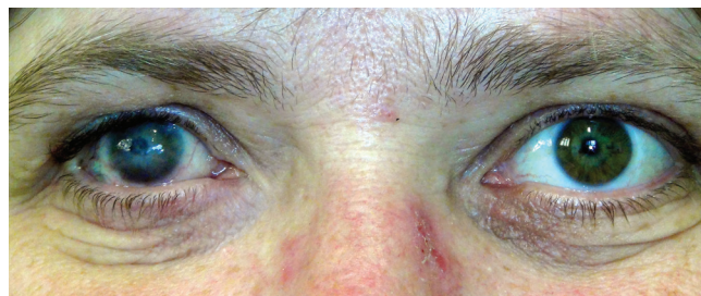
Obrázek 8 a 9. Pac. č. 4 pred a po zákroku KTP