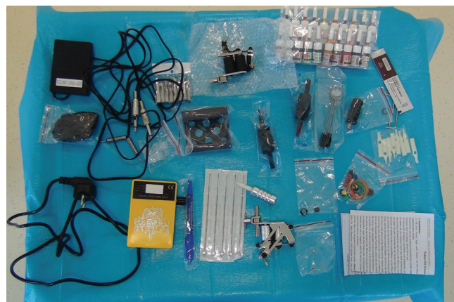
Obrázek 1. Tetovacia sada a pigmenty

Podľa zdravotnej dokumentácie pacient absolvoval niekoľko operácií ľavého oka (vrátane pars plana vitrektómie) v súvislosti s úrazom v minulosti. Objektívne najlepšia korigovaná centrálna zraková ostrosť (NKCZO) pravého oka bola 1,0 a u ľavého oka bola prítomná amauroza. Na rohovke ľavého oka bol sýty leukóm, v centre s náznakom zonulárnych zmien. Prítomný bol tiež divergentný strabizmus (ex anopsia) ľavého oka. Ultrasonografickým B scan vyšetrením sme verifikovali vysokú totálnu inveterovanú amóciu sietnice, vnútroočný tlak bol palpačne nižší – tlak nebolo možné