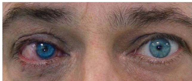
Obrázek 6 a 7. Pac. č. 3 pred a po zákroku KTP