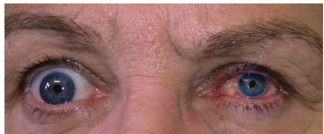
Obrázek 4 a 5. Pac. č. 2 pred a po zákroku KTP