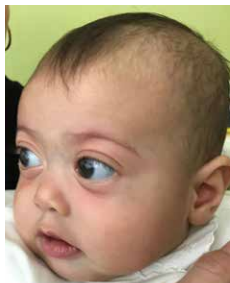
Obr. 2: Dysmorfia strednej časti tváre, plytké orbity, pseudoexoftalmus, hypertelorizmus a nízky koreň nosa u pacientky s Marshall/Sticklerovým syndrómom vo veku 4 mesiacov.