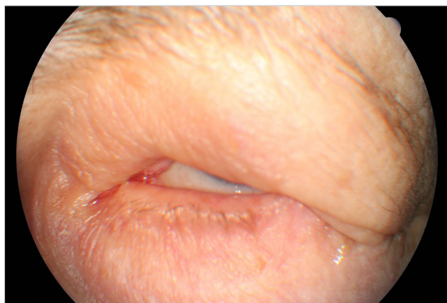
Obr. č. 2 Klinický obraz pacientky č. 1 v r. 2015 pri maximálnom úsilí o uzavretie mihalnicovej štrbiny