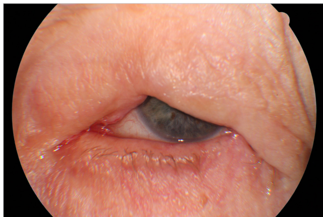
Obr. č. 1: Klinický obraz pacientky č. 1 v r. 2015

Odoslaná k oftalmológovi v máji 2012 pre dva mesiace trvajúci drobný vaskularizovaný tumorček na okraji hornej mihalnice, prechádzajúci na intermarginálnu plôšku, vnútorné margo zachované. Ambulantne elektrokauterizácia tumoru. O 6 mesiacov má opäť ťažkosti, indikovaná exkochleácia chalasea hornej mihalnice ľavého oka. Nález je nezlepšený, preto o 3 mesiace aplikovaný Diprohos inj. do ložiska. Subjektívne sa nález zhoršuje, mihalnica je opuchnutá. Sledovaná u rajónneho oftalmológa. V marci 2013 odoslaná znovu do nemocnice pre pretrvávajúci 2 cm veľký granulomatózny tumor mihalnice, okraje navahlité, tumor vaskularizovaný, cez