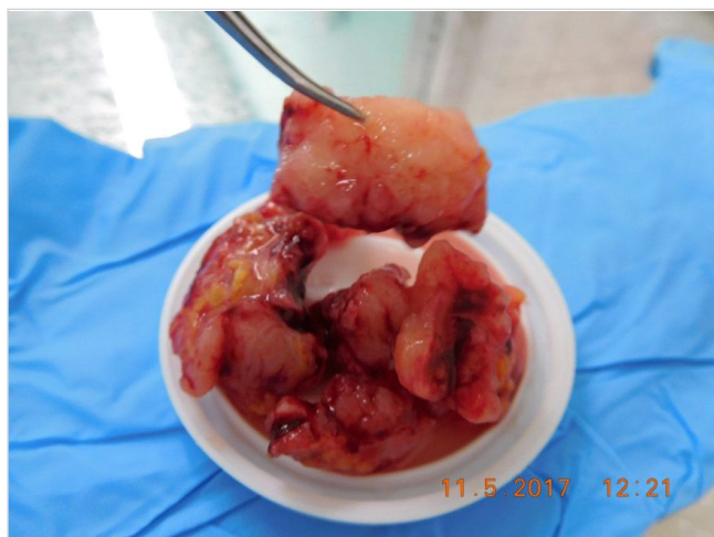
Obr. č. 7: Nádorové masy odstránené počas zákroku, na reze belavé, droľivé, neopúzdrené