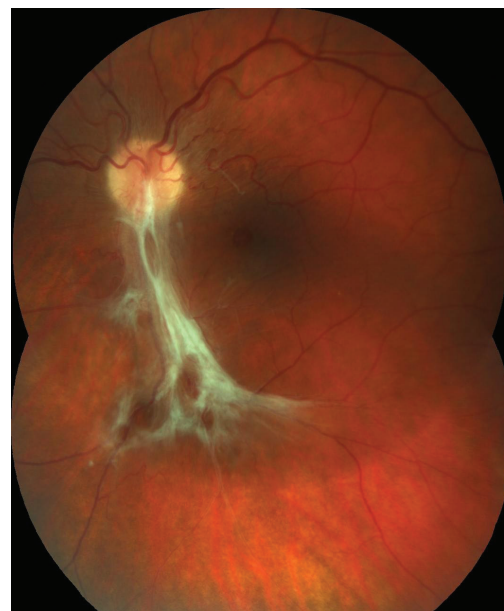
Obr. 5 Barevný fotografický snímek fundu levého oka: preretinální fibróza při dolní temporální arkádě způsobující nařasení sítnice v centrální krajině

Vyšetření předního segmentu na štěrbinové lampě odhalilo PAH OP s úponem distálního úseku k zadnímu pouzdru čočky (obr. 3), dále nález na OP i OL fyziologický. Fundoskopie v mydriáze OP ukázala proximální část PAH Inoucí k horní temporální arkádě, kde podmínila vznik lokálního TOS star-