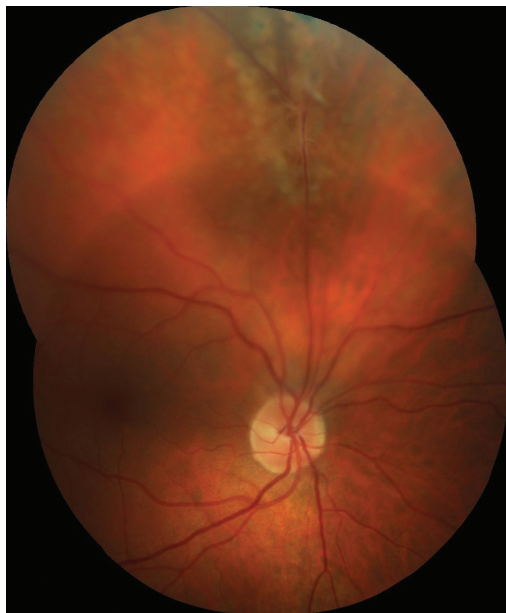
Obr. 4 Barevný fotografický snímek fundu pravého oka: proximální úsek perzistující arteria hyaloidea upínající se k horní temporální arkádě s lokálním trakčním odchlípením sítnice staršího data