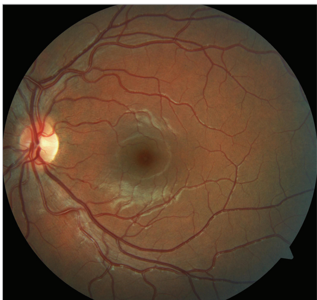
Obr. 2 Barevný fotografický snímek fundu levého oka: na očním pozadí fyziologický nález

První kazuistika: 15letá dívka byla na naše pracoviště odeslána spádovým očním lékařem ke zhodnocení očního nálezu po útoku chovankyněmi Dětského domova, kde byla opakovaně kopnuta do hlavy, především do oblasti pravého