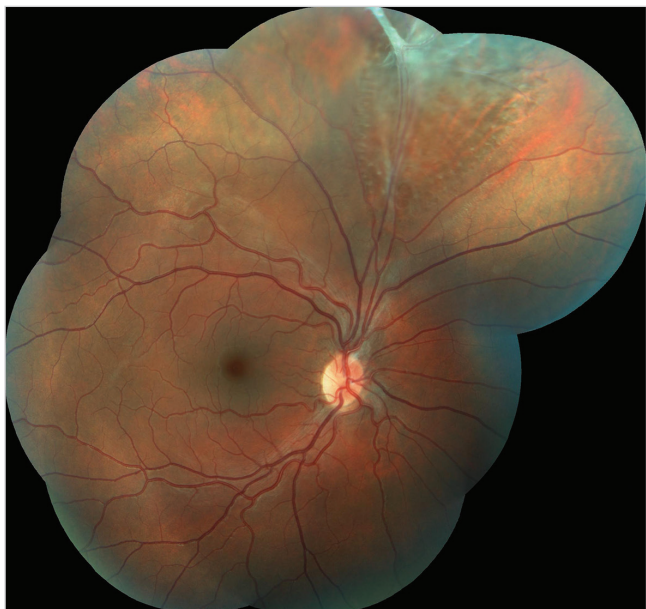
Obr. 1 Barevný fotografický snímek fundu pravého oka: sítnice je v horních kvadrantech prořídla, při horní temporální arkádě jsou pozůstatky perzistující arteria hyaloidea s fibrotickou tkání způsobující lokální retinoschízu staršího data

viště ke zvážení dalšího postupu. Obě pacientky si dlouhodobě stěžovaly na postupně se zhoršující vidění a pocity tlaku v očích. Vyšetření očního pozadí v mydriáze odhalilo preretinální fibrózu způsobující v jednom případě lokální trakční odchlípení sítnice (TOS) a ve druhém případě lokální retinoschízu.