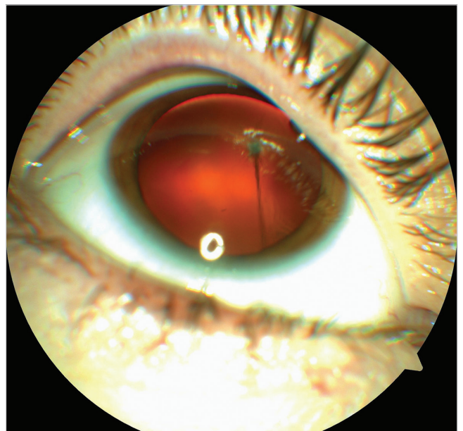
Obr. 3 Barevný fotografický snímek předního segmentu pravého oka: perzistující arteria hyaloidea upínající se k zadní části pouzdra nitrooční čočky

Druhá kazuistika: Pacientka, 35letá žena, přichází na naši kliniku ke konzultaci stran operačního řešení stavu sítnice OL, které bylo doporučeno na jiném pracovišti. Vstupně udává asi rok trvající zhoršování vidění na OL, kdy nejvíce obtěžuje únava při práci a pocit tlaku v OL. Anamnesticky se pacientka dlouhodobě s ničím neléčí, pravidelně žádné léky neužívá. Kompletní oční vyšetření podstoupila naposledy asi před deseti lety, brýlovou korekci nenosí, ale udává provedení laserového ošetření sítnice OL před 15 lety. NZO OP byla 0,8, korekce nelepšila a NZO OL 0,12, s korekcí +2,0sf / -1,0cyl / 100° 0,6 paracentrálně, NOT měřený bezkontaktně v normě, vpravo 19 torrů a vlevo 16 torrů.